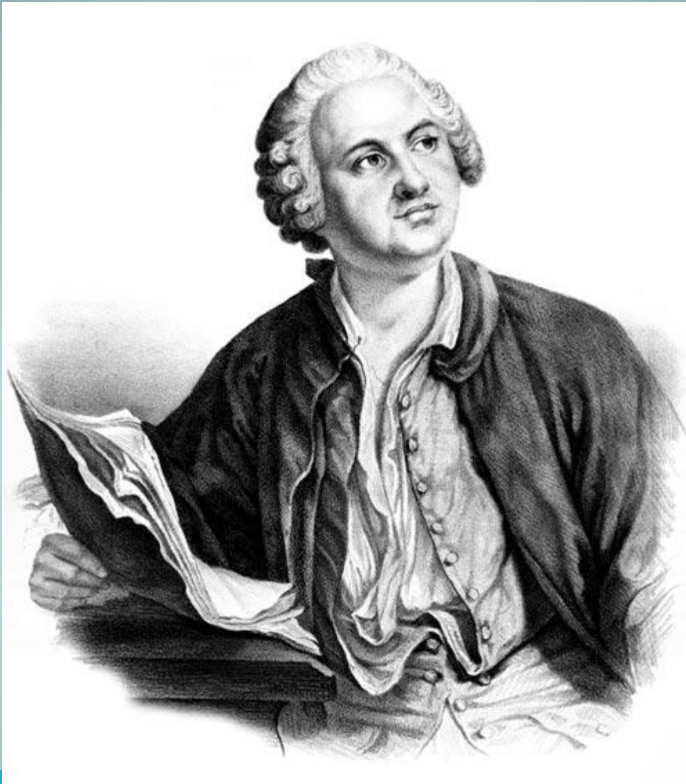
Михаил Ломоносов (1711-1765)