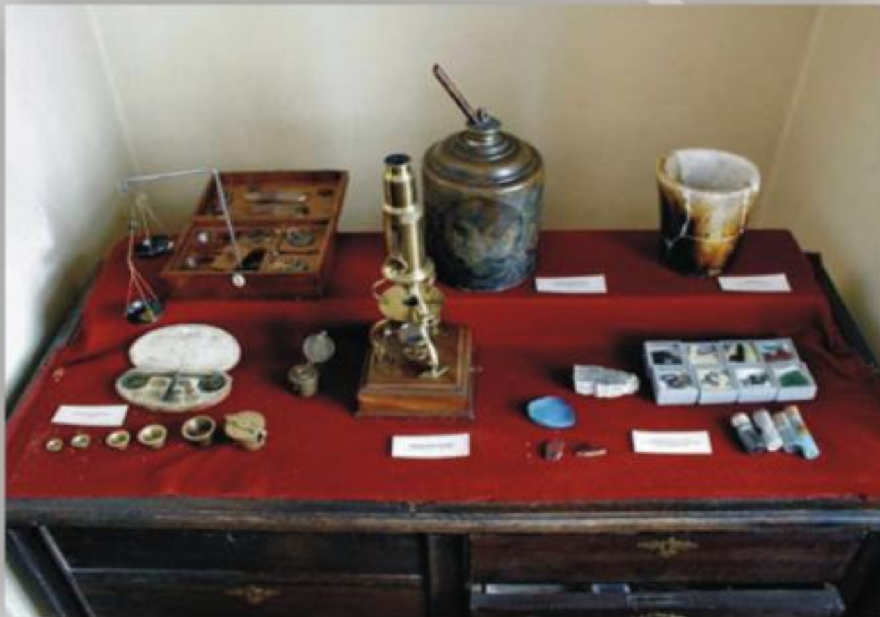
Стол химика. Экспонаты химической лаборатории М.В. Ломносова.

Приготовление смальт хранилось в строгой тайне итальянскими мастерами. Ломоносова-химика привлекала к себе задача раскрыть этот секрет и самостоятельно разработать рецептуру для получения смальт.