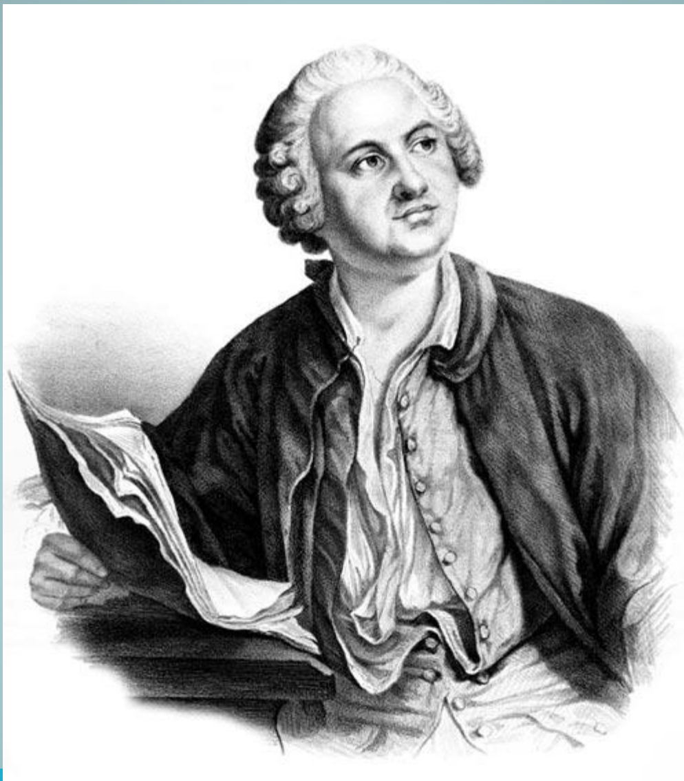
Михаил Ломоносов (1711-1765)