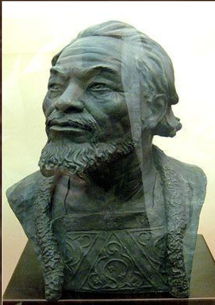
Андрей Боголюбский. Скульптурный портрет-реконструкция М. Герасимова