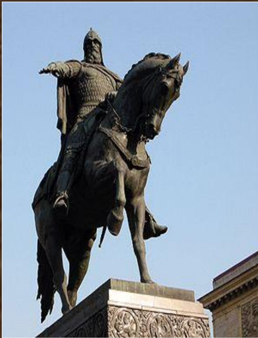
С. Орлов, А. Антропов, Н. Штамм. Памятник Юрию Долгорукому, 1954 г. бронза. Тверская площадь, Москва