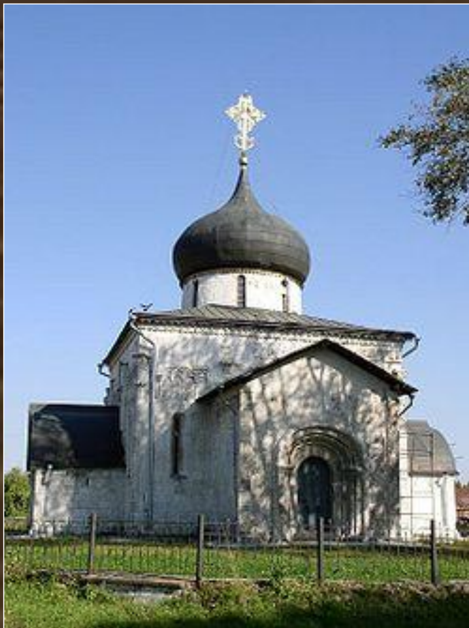
Георгиевский собор в Юрьеве-Польском. XIII в.