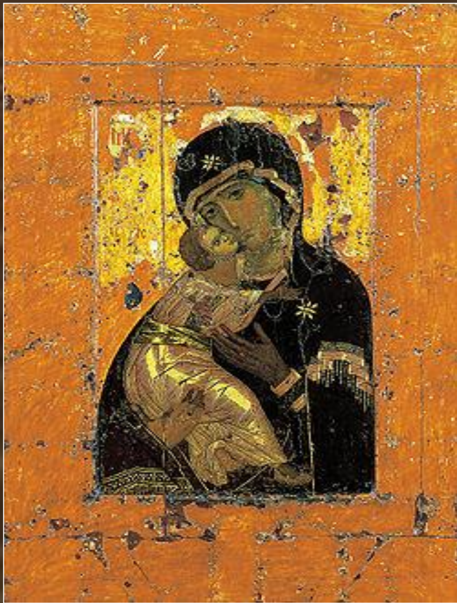
Богоматерь Владимирская. Икона. XII в.