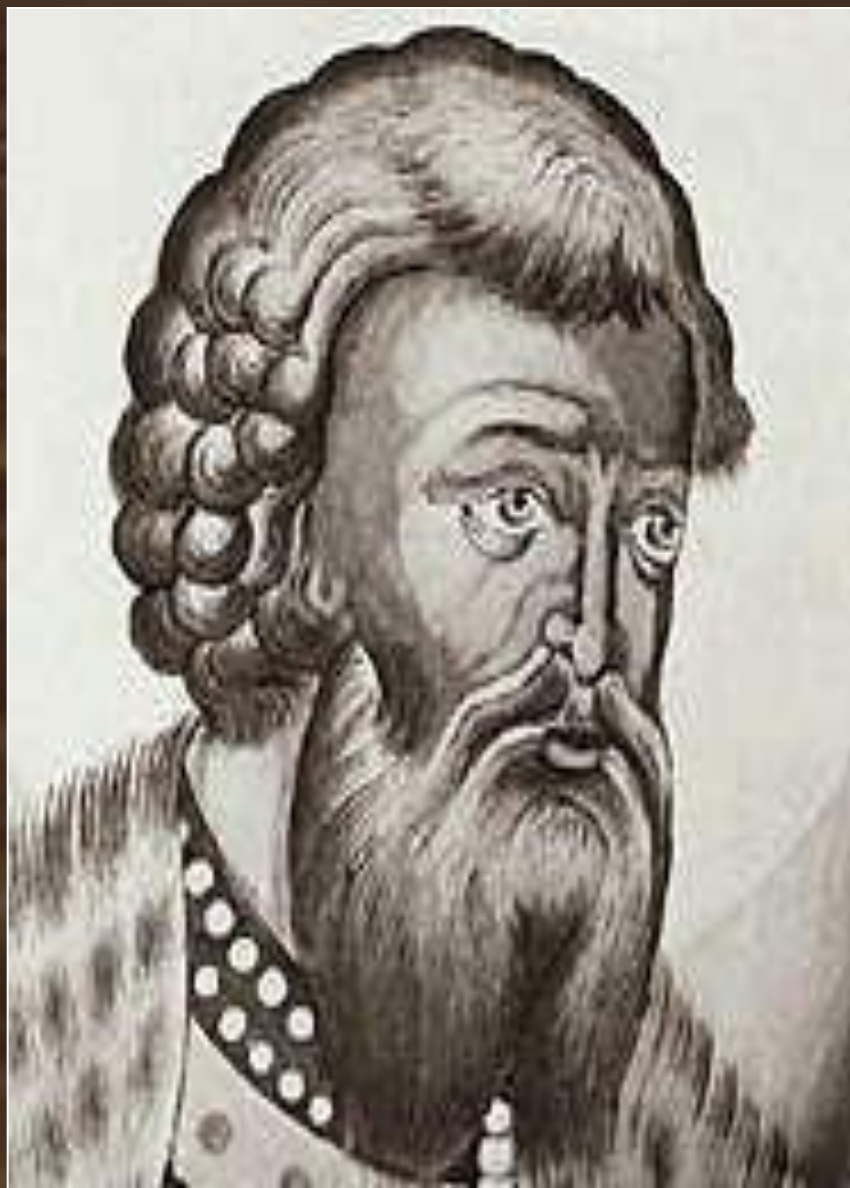
Всеволод Большое Гнездо