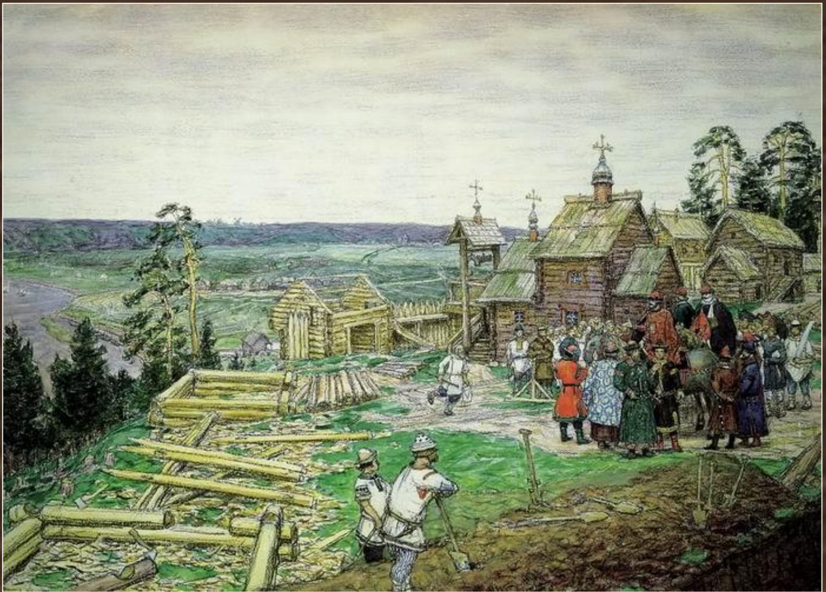
Основание Кремля. Постройка новых стен Кремля Юрием Долгоруким в 1156 году.