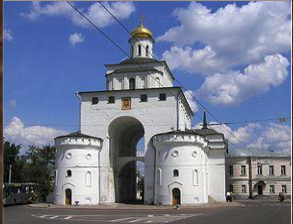
Успенский собор и Золотые ворота во Владимире. XII в.