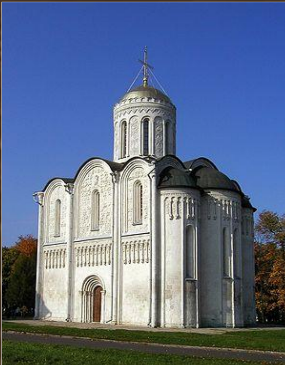
Дмитриевский собор во Владимире. XII в.