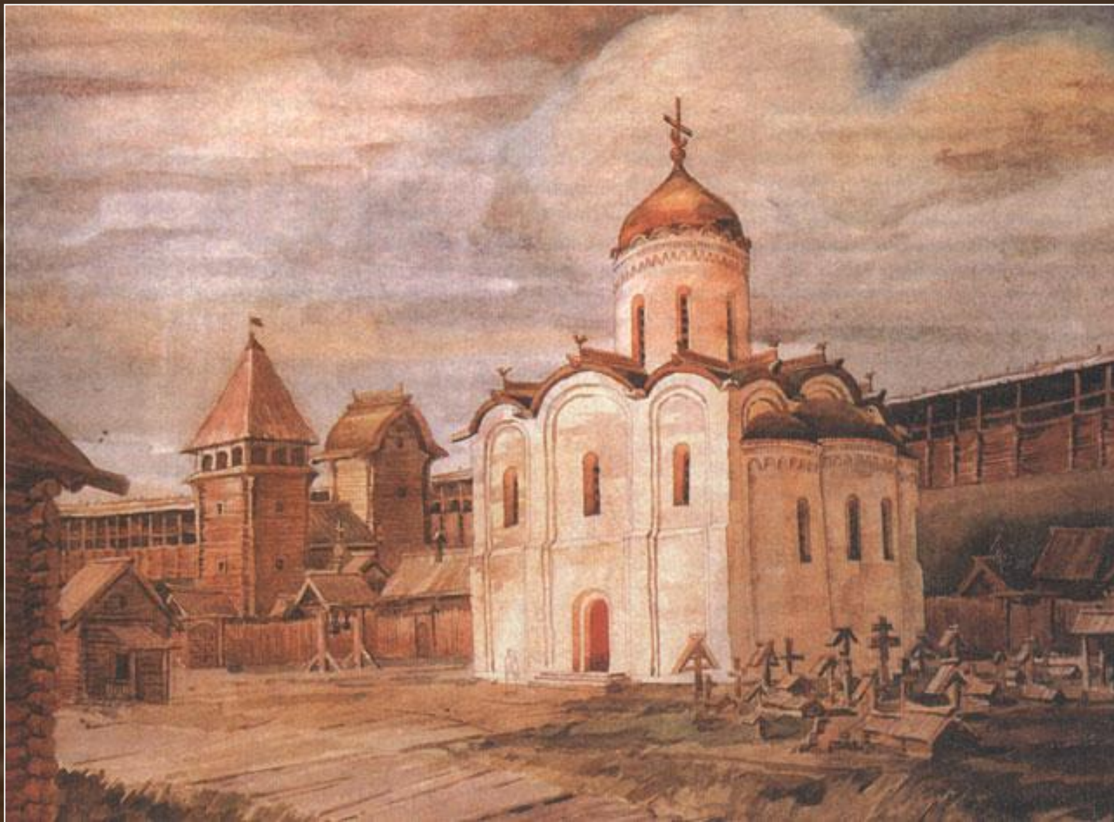
Спасо-Преображенский собор в Переяславле-Залесском. XII в.