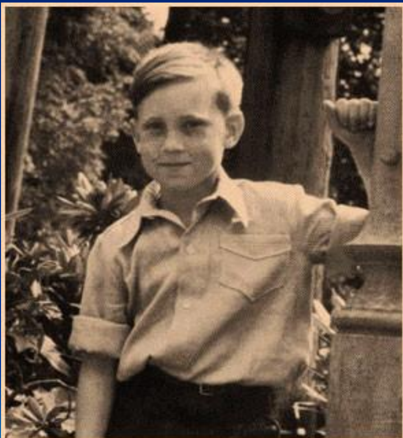
г.Бад Эльстер, Германия, 1948 г.