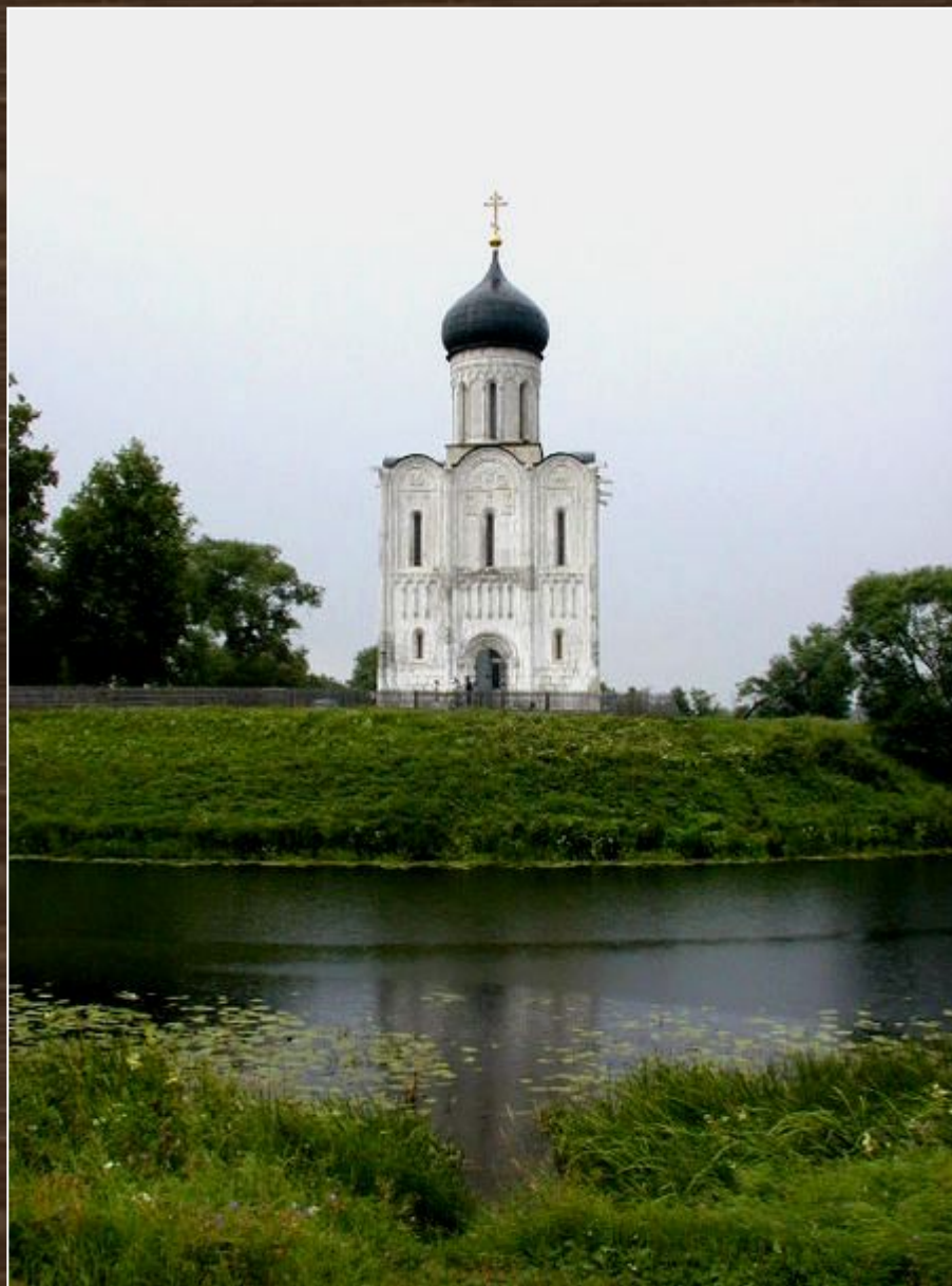
Церковь Покрова на Нерли. XII в.