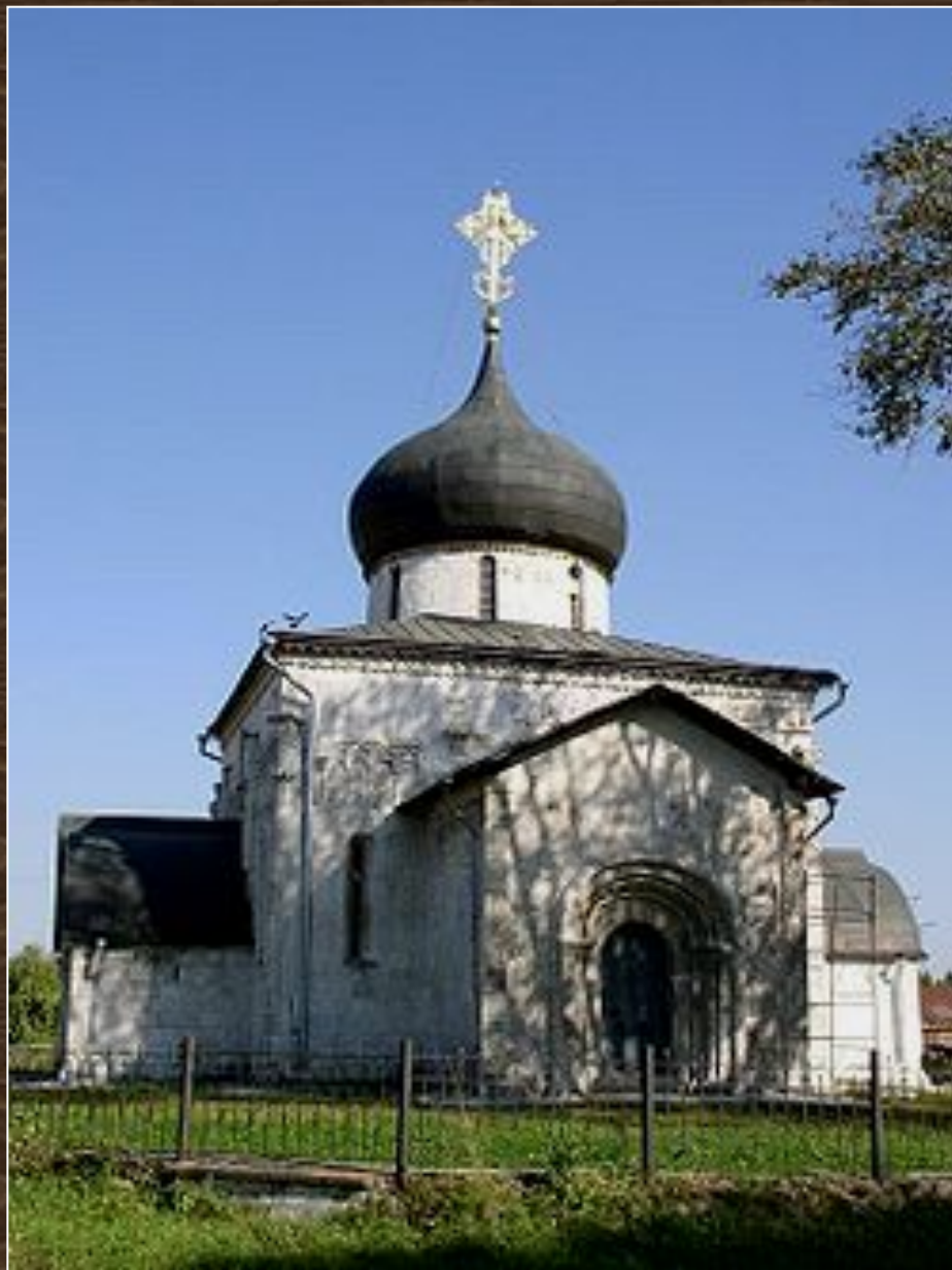
Георгиевский собор в Юрьеве-Польском. XIII в.