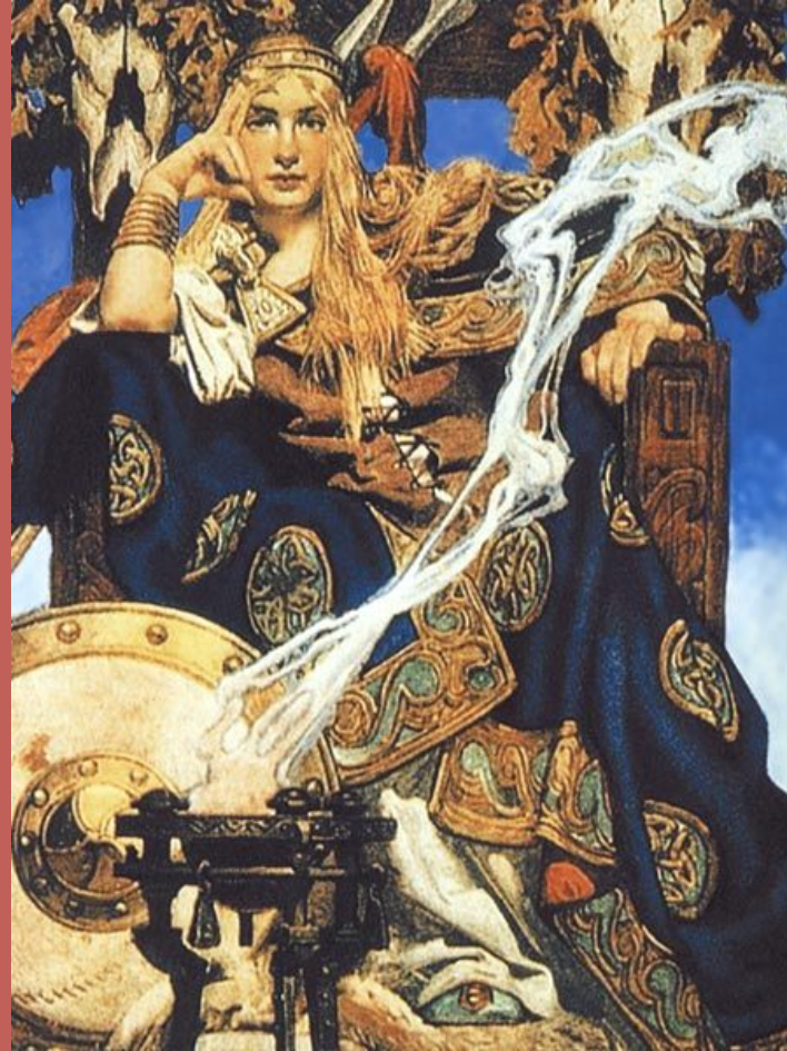
«Королева Медб». Дж.Лейердекер, 1916