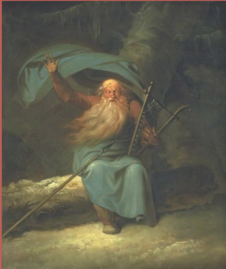
«Оссиан», Николай Абилдгаард