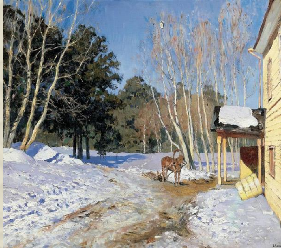
И. И. Левитан «Март»

Природа на картине изображена без лишних подробностей, словно «крупным планом». Экспрессивность цветовой гаммы «Марта» и некоторые приемы письма напоминают те, что использовали в своем творчестве импрессионисты. Но, в отличие от них, Левитан сохраняет цвет каждого изображаемого объекта и заботится о предметной ясности изображения.