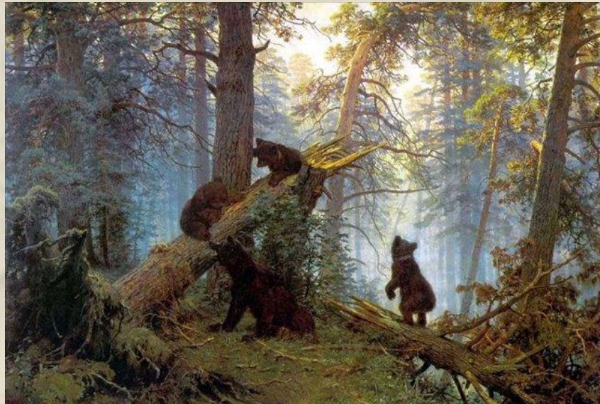
И. И. ШИШКИН «УТРО В СОСНОВОМ ЛЕСУ»

Проснулись обитатели чащи – три медвежонка и медведица. Похоже, малыши сыты и довольны. Они беззаботно и неуклюже возятся на сломанном стволе упавшей сосны, а медведица внимательно наблюдает за их игрой, чутко реагируя на шорохи пробуждающегося леса. Могучая сосна, которую ураган когда-то выдернул с корнем, и медвежье семейство, резвящееся на нем, - все это рождает у нас ощущение глухости и отдаленности этого уголка дикой природы.