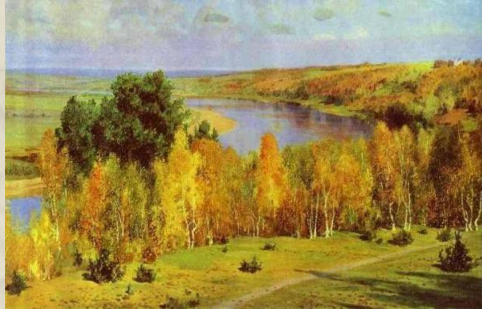
ПОЛЕНОВ «ЗОЛОТАЯ ОСЕНЬ»

Удивительно сочно и емко переданы цвета и краски - волшебство проникло в плавные линии и изгибы водной глади, в небеса, нависающие над холмами, в лес и купол церквушки, оживляя и делая всё это объёмным и настоящим. Строгое величие окрестностей у берегов Оки привлекает взгляд – тепло последних осенних дней, кажется, стекает с полотна и разливается по залу. Солнечные зайчики и блики от воды заставляют шуриться и улыбаться, вспоминая такие же дни из своей жизни. Холмы, очерченные мягкими, текучими линиями, медленно исчезают, растворяются в безграничной дали. И только крохотная часть огромной равнины попадает в оттиск художника – и река, и деревья, и громады холмов, словно мазки какой-то большой иной картины.