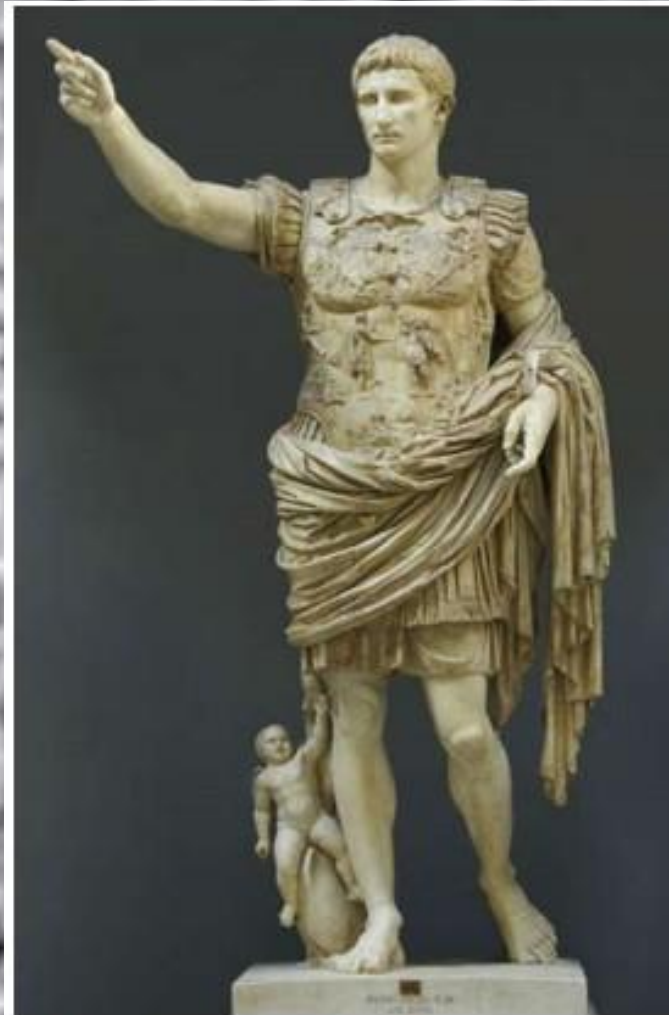
Август из Прима Порто. Римская статуя

Искусство как проявление свободных, творческих сил человека, полет его фантазии и духа часто использовалось для укрепления власти, — светской и религиозной.