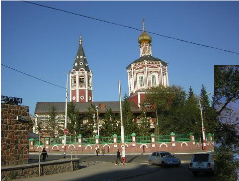
Собор святой Троицы

Можно ли назвать эти архитектурные сооружения ансамблем или комплексом?