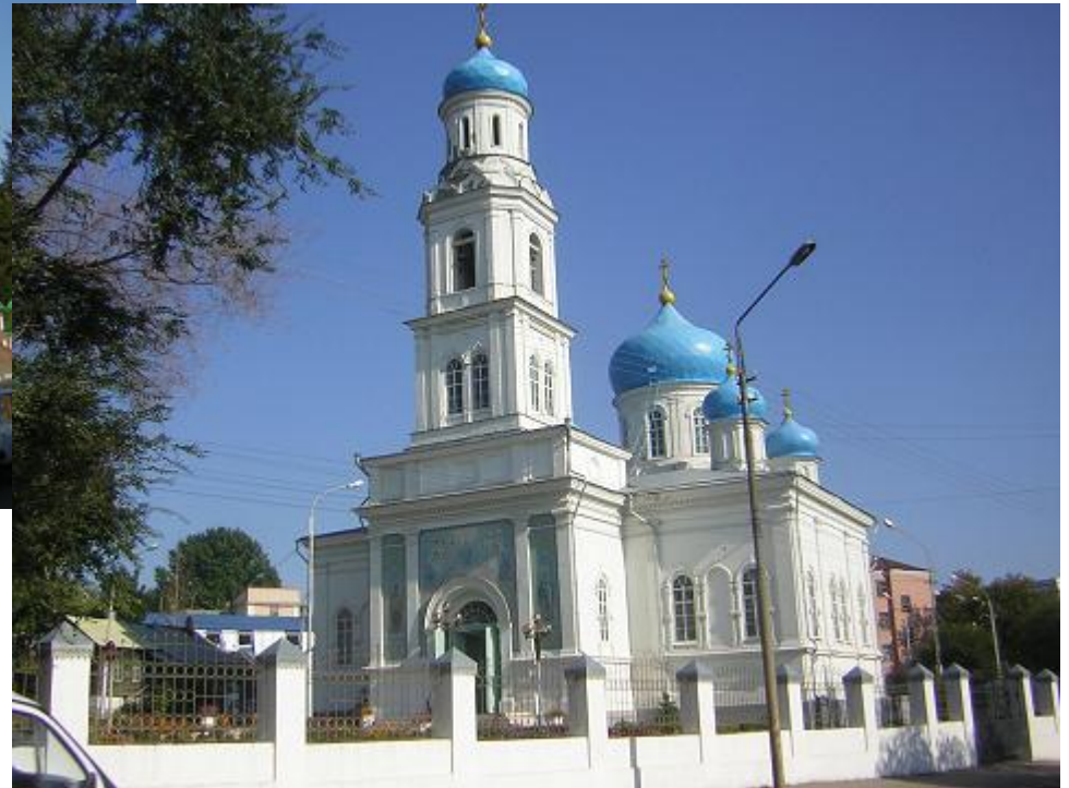
Собор на Соколовой горе