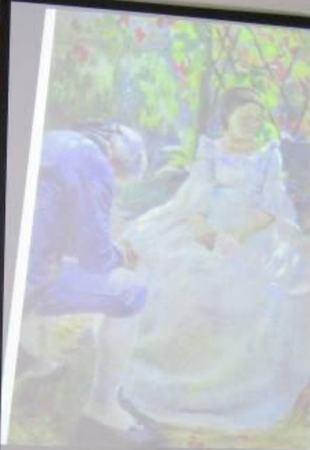
«Осенний мотив» (1899 г.)