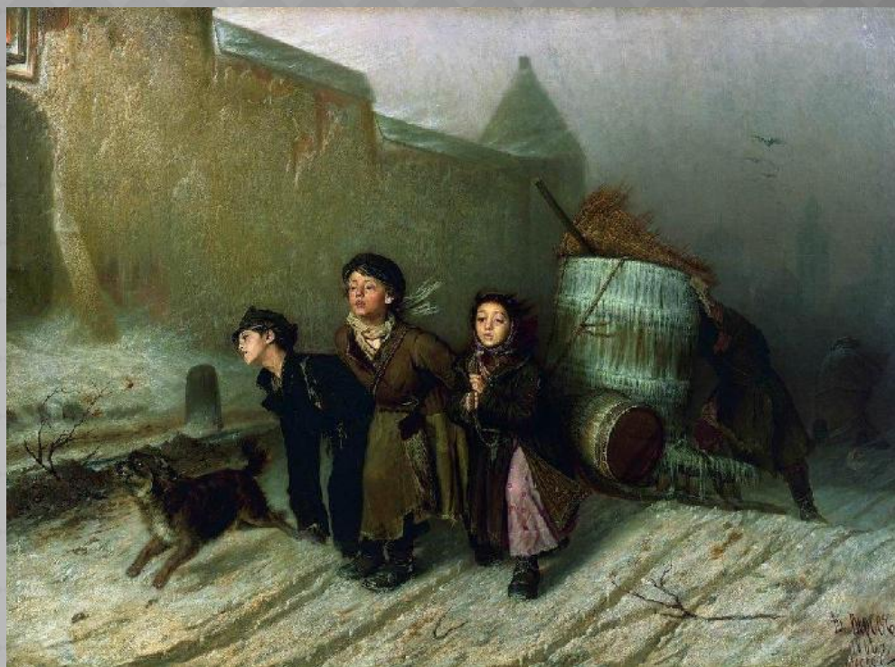
Тройка. Ученики мастеровые везут воду. 1866