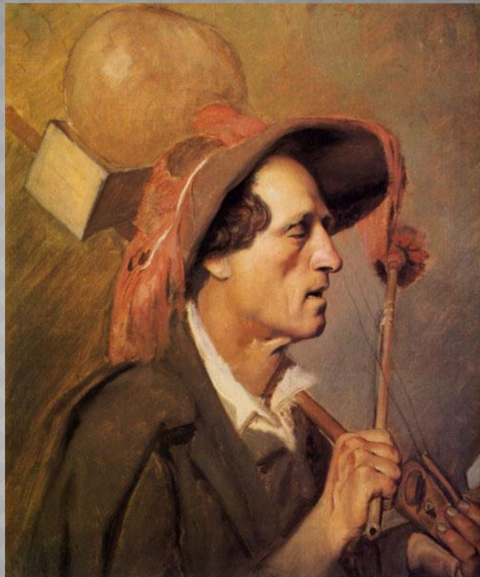
Слепой музыкант. 1864