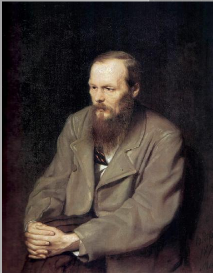
Портрет Ф.М. Достоевского. 1872