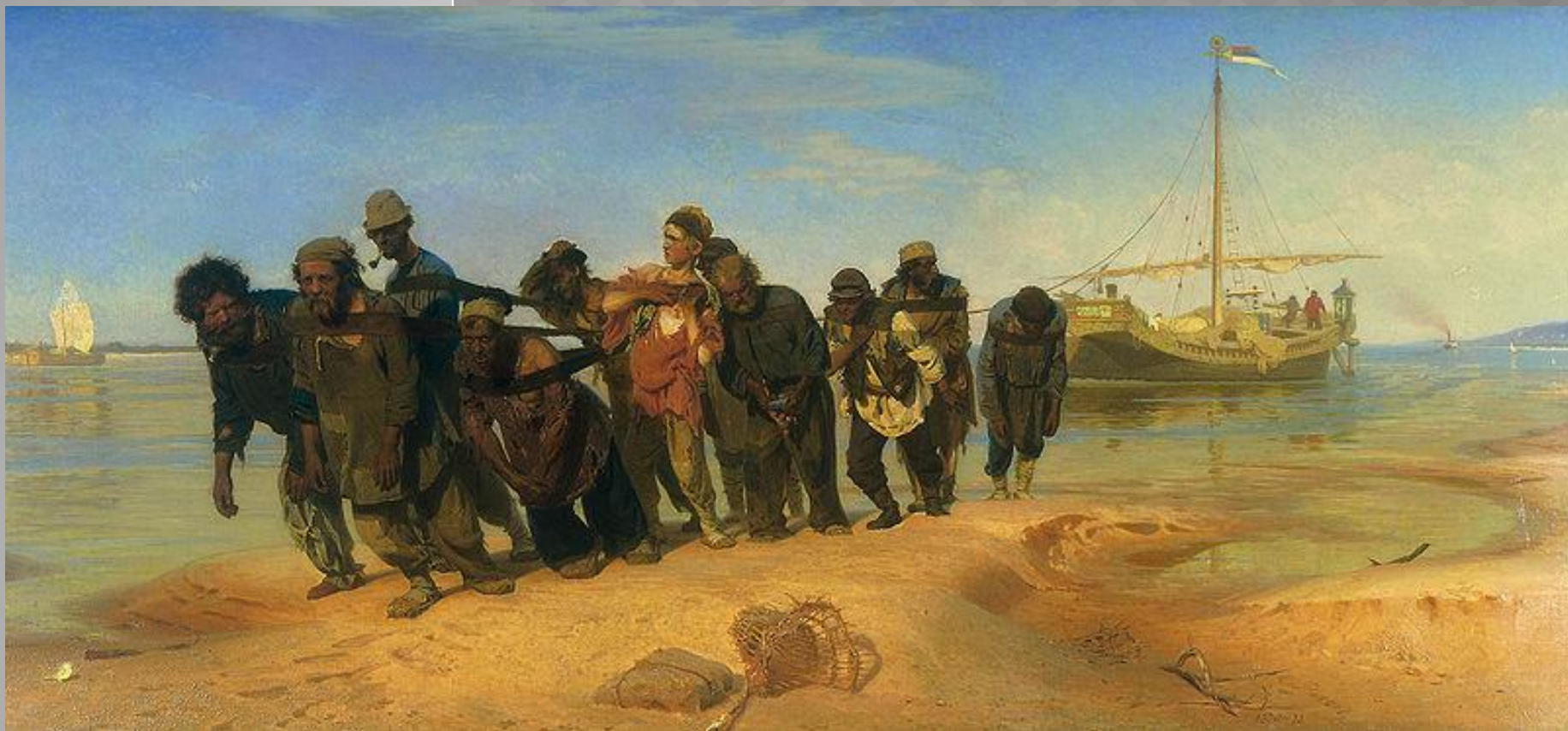
Бурлаки на Волге. 1873