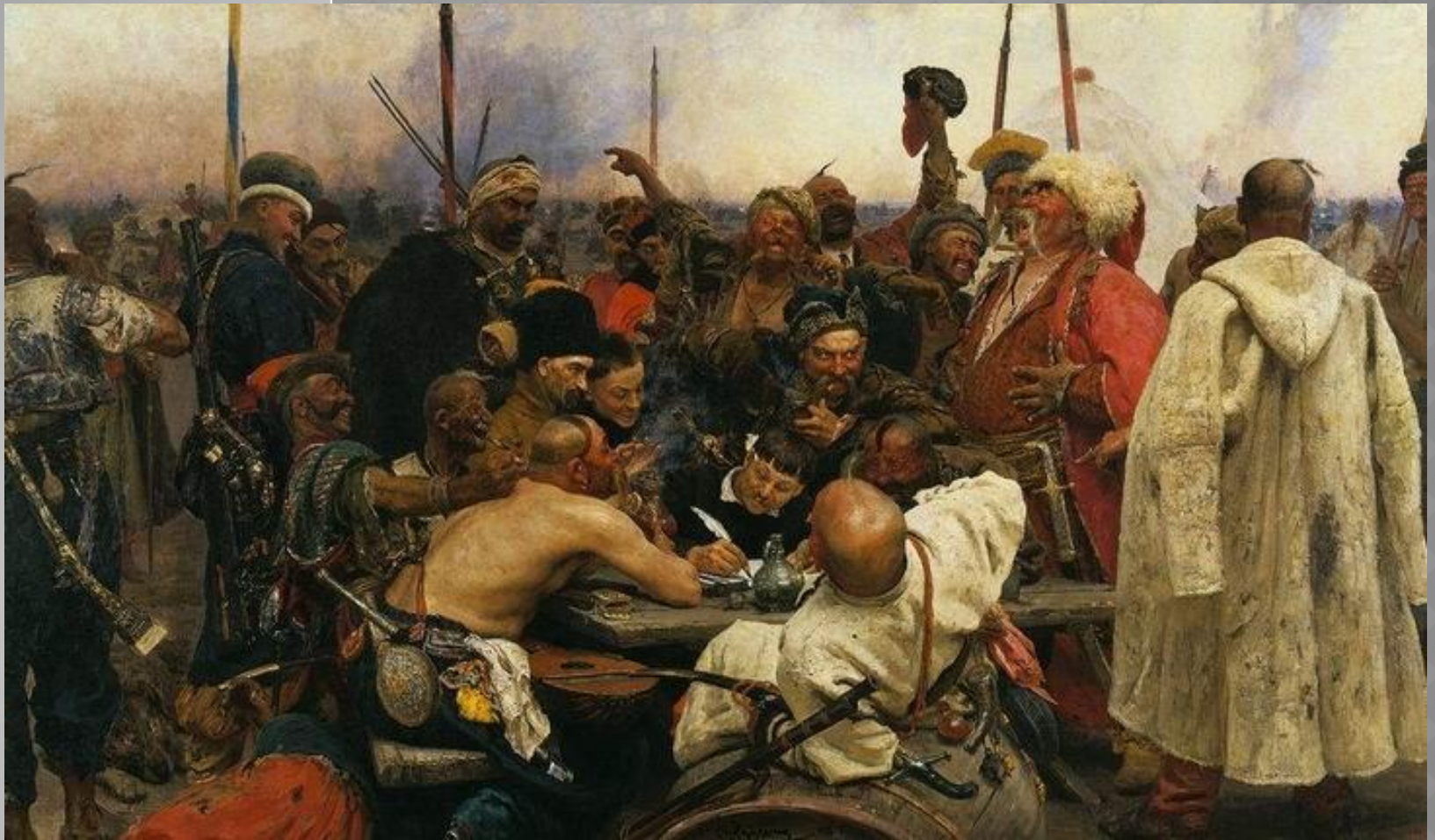
Запорожці пишуть письмо турецькому султану. 1880 - 1891