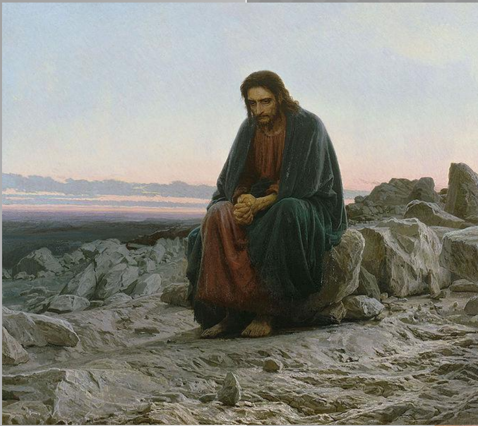
Христос в пустыне. 1872