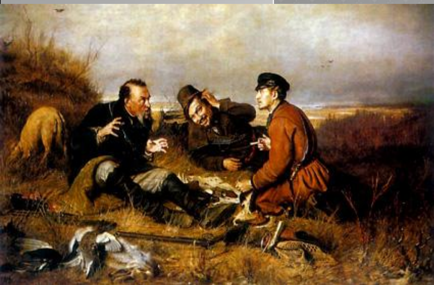
Охотники на привале. 1871