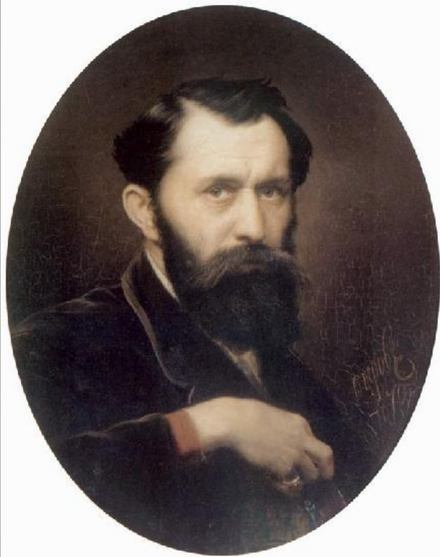
Василий Григорьевич Перов (1833-1882)

ЯРКИЙ ПРЕДСТАВИТЕЛЬ РУССКОГО КРИТИЧЕСКОГО РЕАЛИЗМА В ИЗОБРАЗИТЕЛЬНОМ ИСКУССТВЕ 19 ВЕКА. РУССКИЙ ЖИВОПИСЕЦ, МАСТЕР БЫТОВОЙ И ЖАНРОВОЙ ЖИВОПИСИ, ПЕДАГОГ.