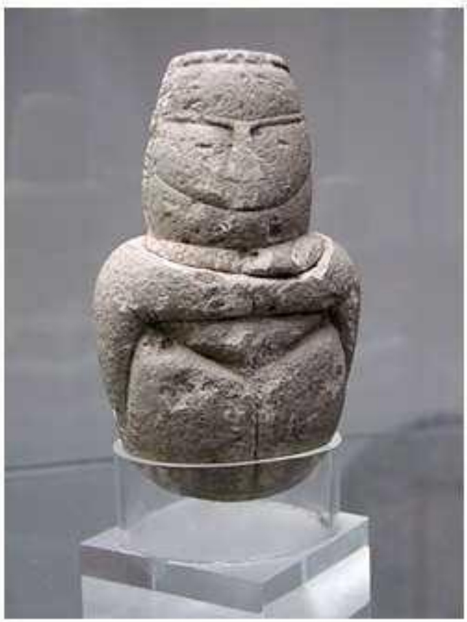
Идоле фигурки Погребальное