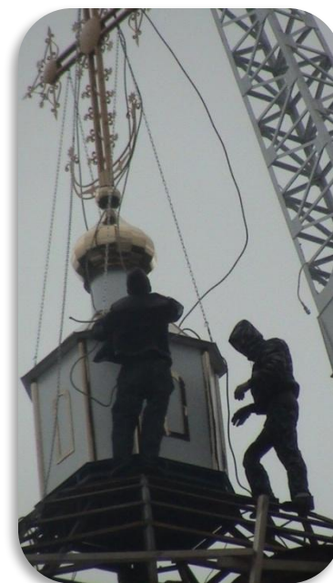
Установка креста на купол колокольни