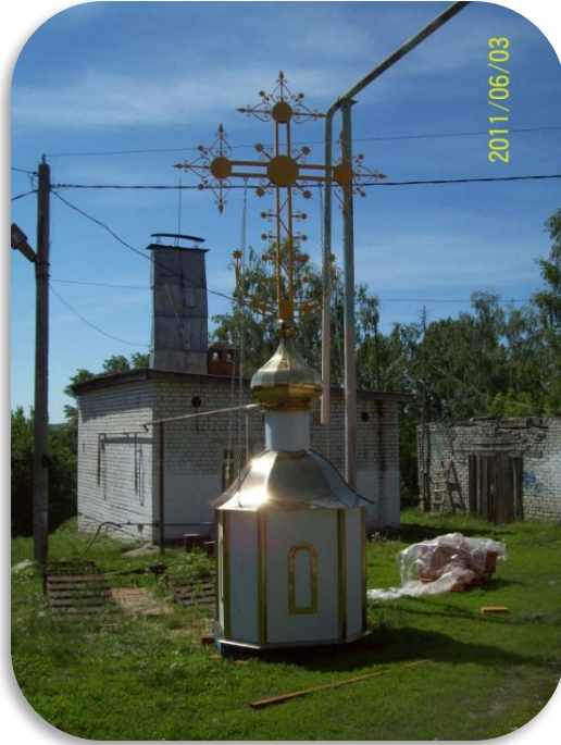
Освящение креста для колокольни отцом Евгением