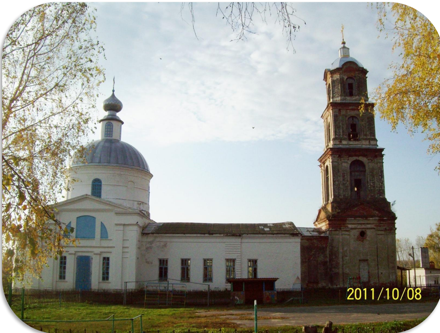
Современный вид храма Вознесения Господня