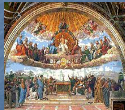
Рафаэль Санти. «Диспута». Ватикан. Рим.