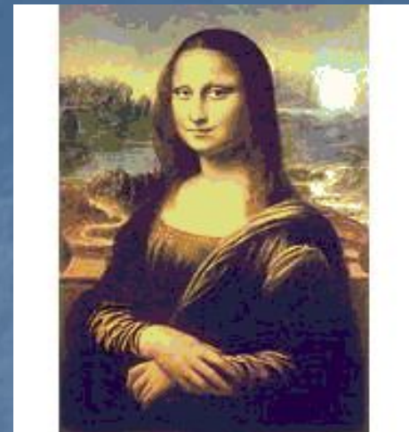
Леонардо да Винчи. «Мона Лиза».

РАФАЭЛЬ САНТИ (Raffaello Santi) (1483-1520), итальянский живописец и архитектор. Представитель Высокого Возрождения.