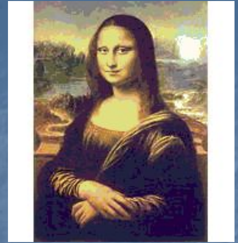
Леонардо да Винчи. «Мона Лиза».

РАФАЭЛЬ САНТИ (Raffaello Santi) (1483-1520), итальянский живописец и архитектор. Представитель Высокого Возрождения.