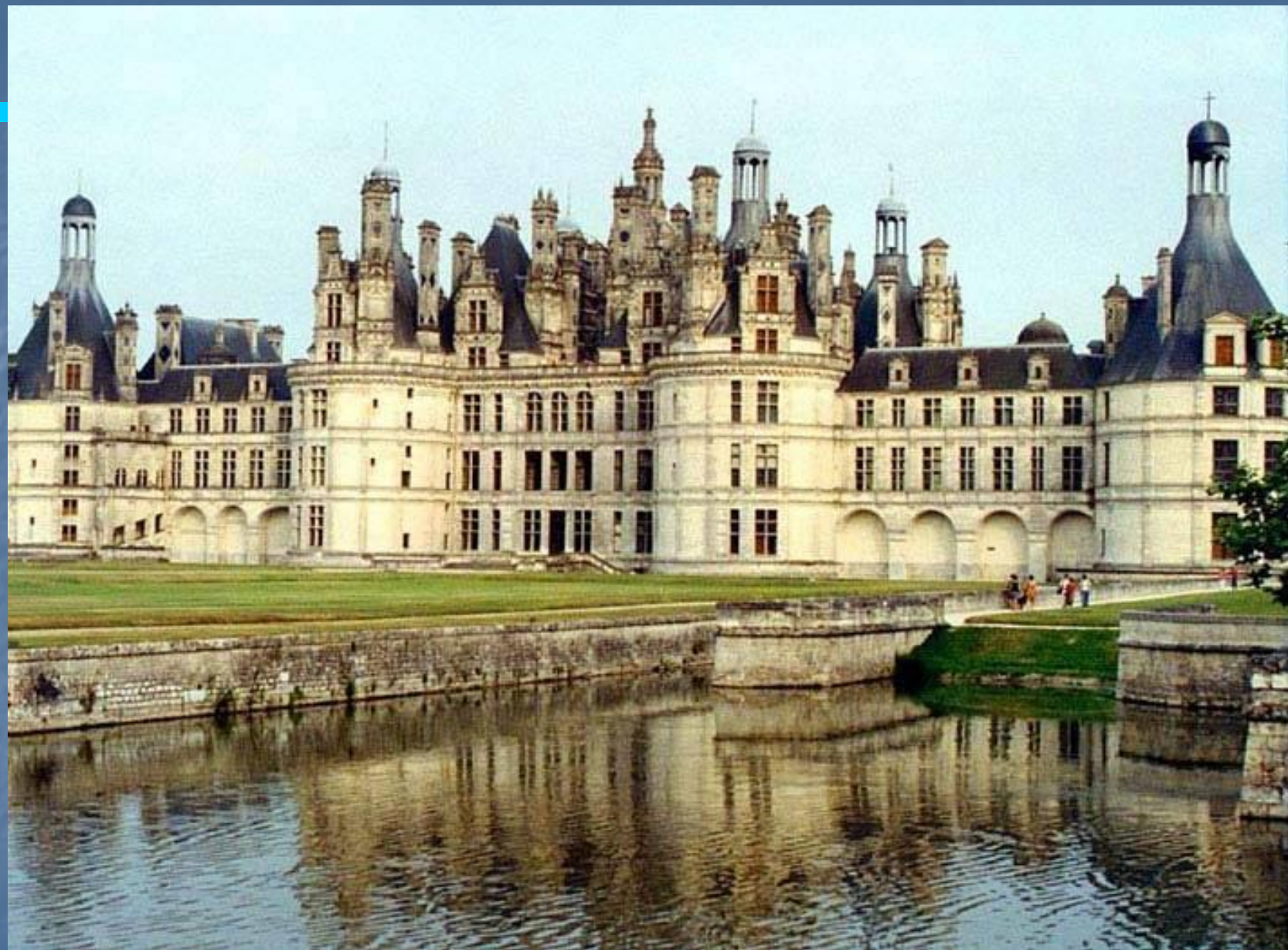
Замок Шамбор. 1519-1559. Франция.