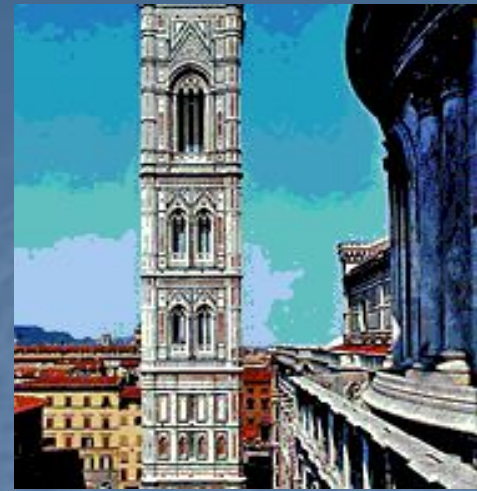
Кампанила собора Санта-Мария дель Фьоре во Флоренции. Построена в 1334-1359 гг.

БОТТИЧЕЛЛИ (Botticelli) Сандро (наст. Алессандро Филипепи, Filiperi) (1445-1510), итальянский живописец. Представитель Раннего Возрождения. Был близок ко двору Медичи и гуманистическим кругам Флоренции.