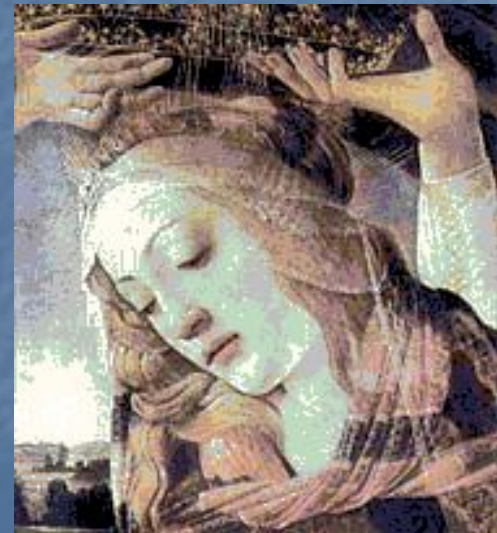
Сандро Боттичелли. Голова Мадонны. Фрагмент.