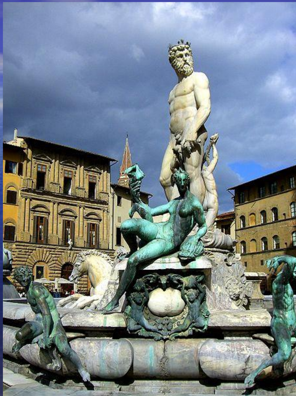
Статуя Нептуна на Пьяцца дела Синьориа