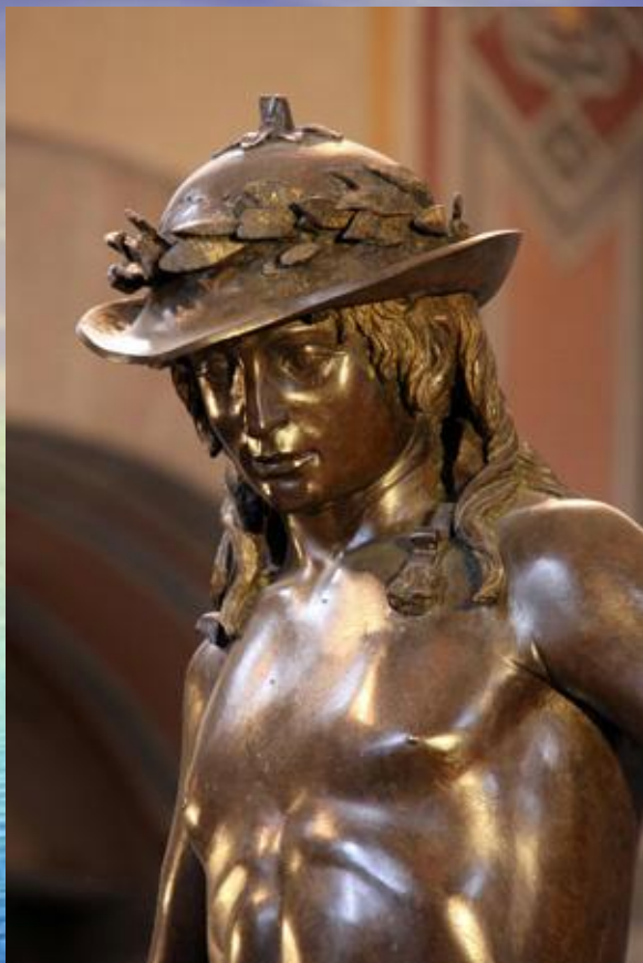
Давид. 1430-е. Национальный музей Барджелло. Флоренция.