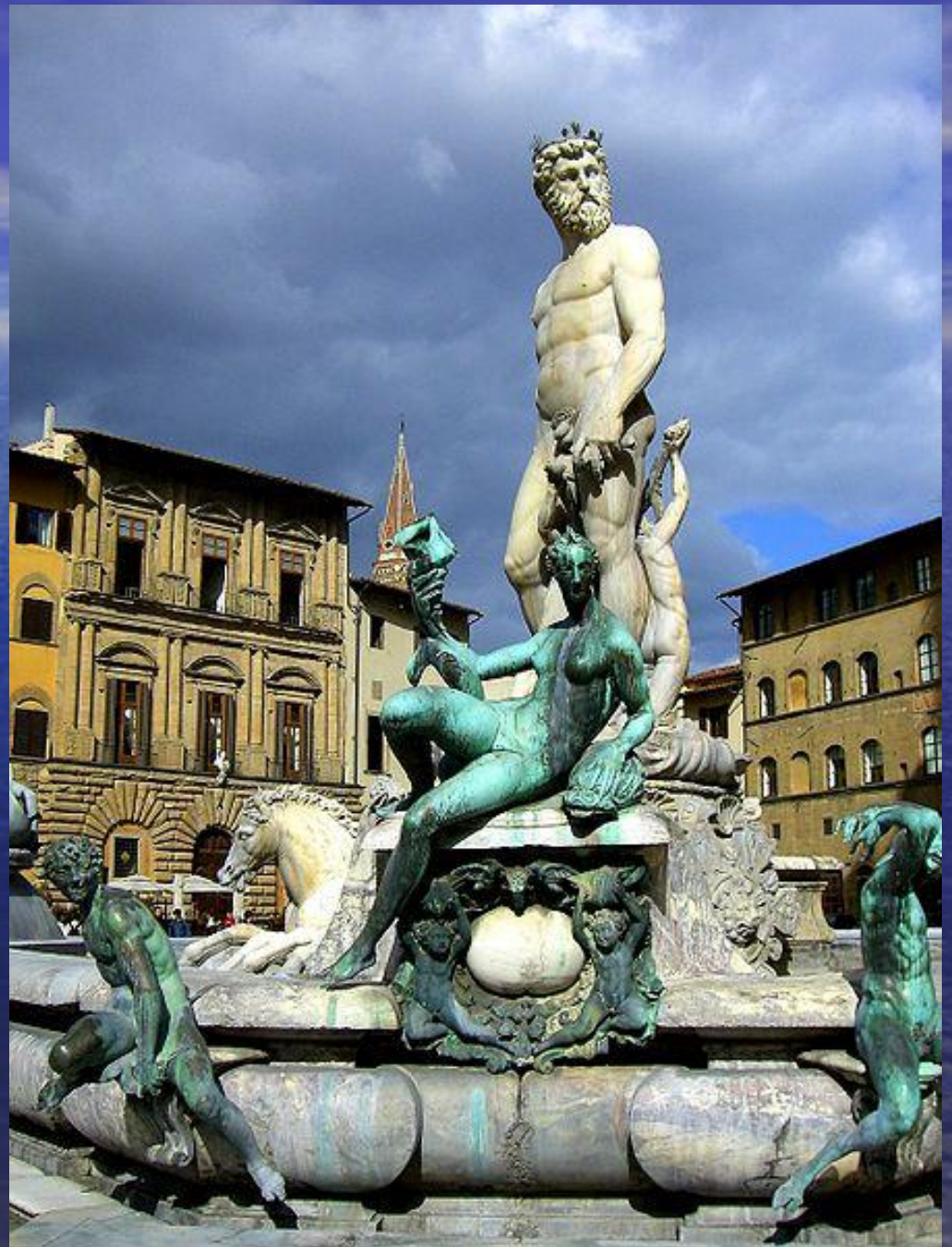
Статуя Нептуна на Пьяцца дела Синьориа