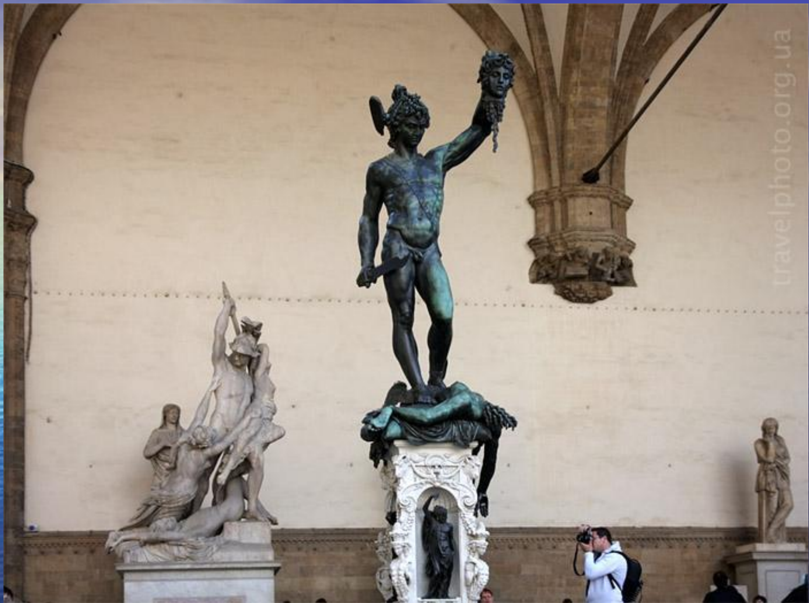
«Персей с головой Медузы» работы Бенвенуто Челлини стоит в Лоджии Ланци (Loggia dei Lanzi)