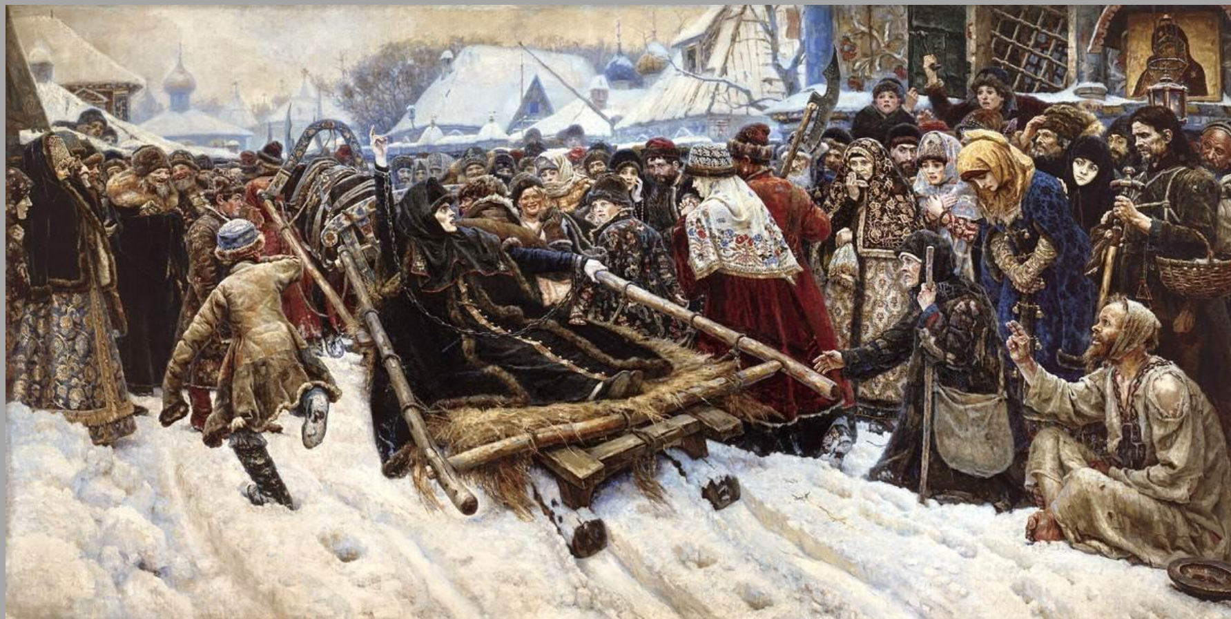
5.3. В.И.Суриков «Боярыня Морозова» 1887г.,х.,м., Государственная Третьяковская галерея