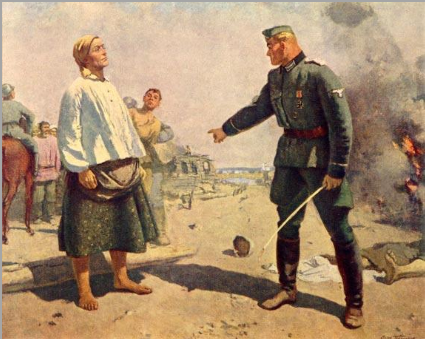
5.6. С.М.Герасимов «Мать партизана» 1942г., х.м., Государственная Третьяковская галерея