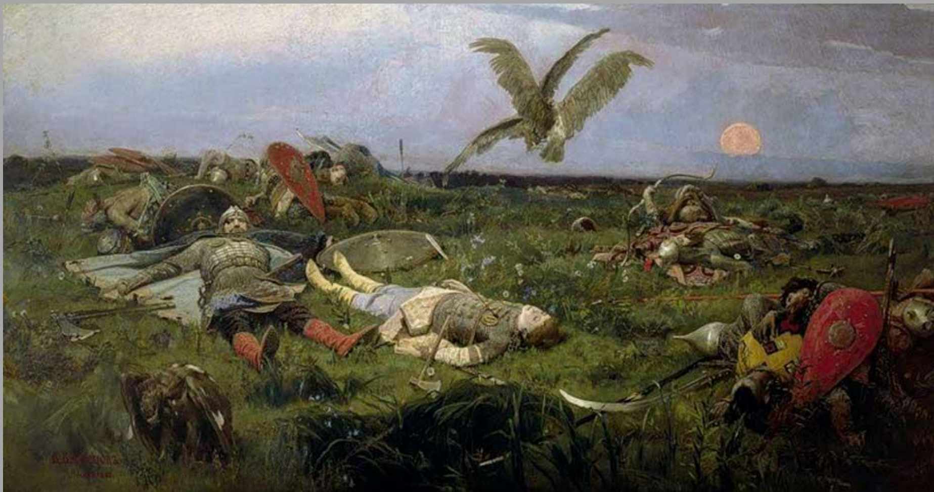
5.2. В.М.Васнецов «После побоища Игоря Святославовича с половцами» 1880г.,х.,м, Государственная Третьяковская галерея