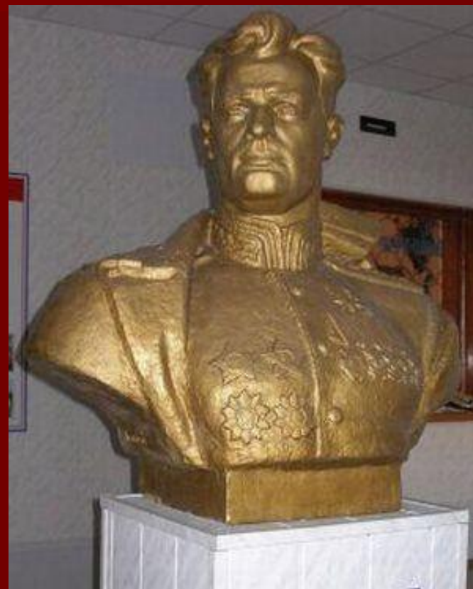
Бюст генерала И.Д. Черняховского