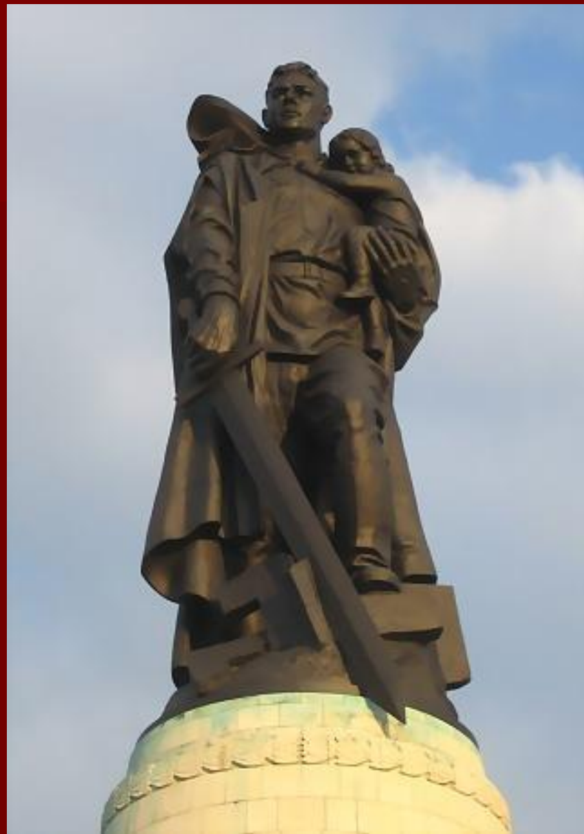
•Трептов - парк. «Воин-освободитель».