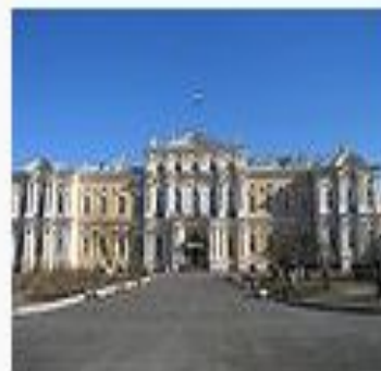
Пажеский корпус (бывший Воронцовский дворец) в Петербурге