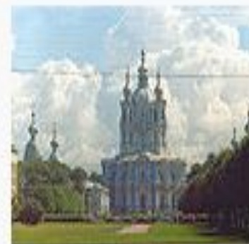
Собор Воскресения Словущего Смольного монастыря (не достроен: нет колокольни, внутреннего убранства) в Петербурге