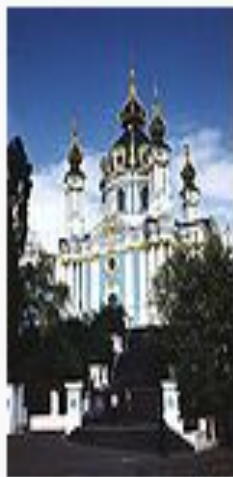
Андреевский собор в Киеве