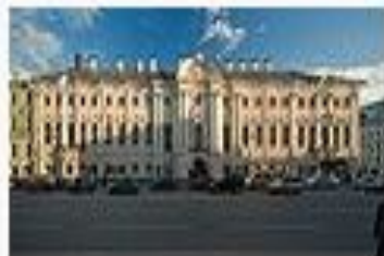
Дворец Строгановых в Петербурге