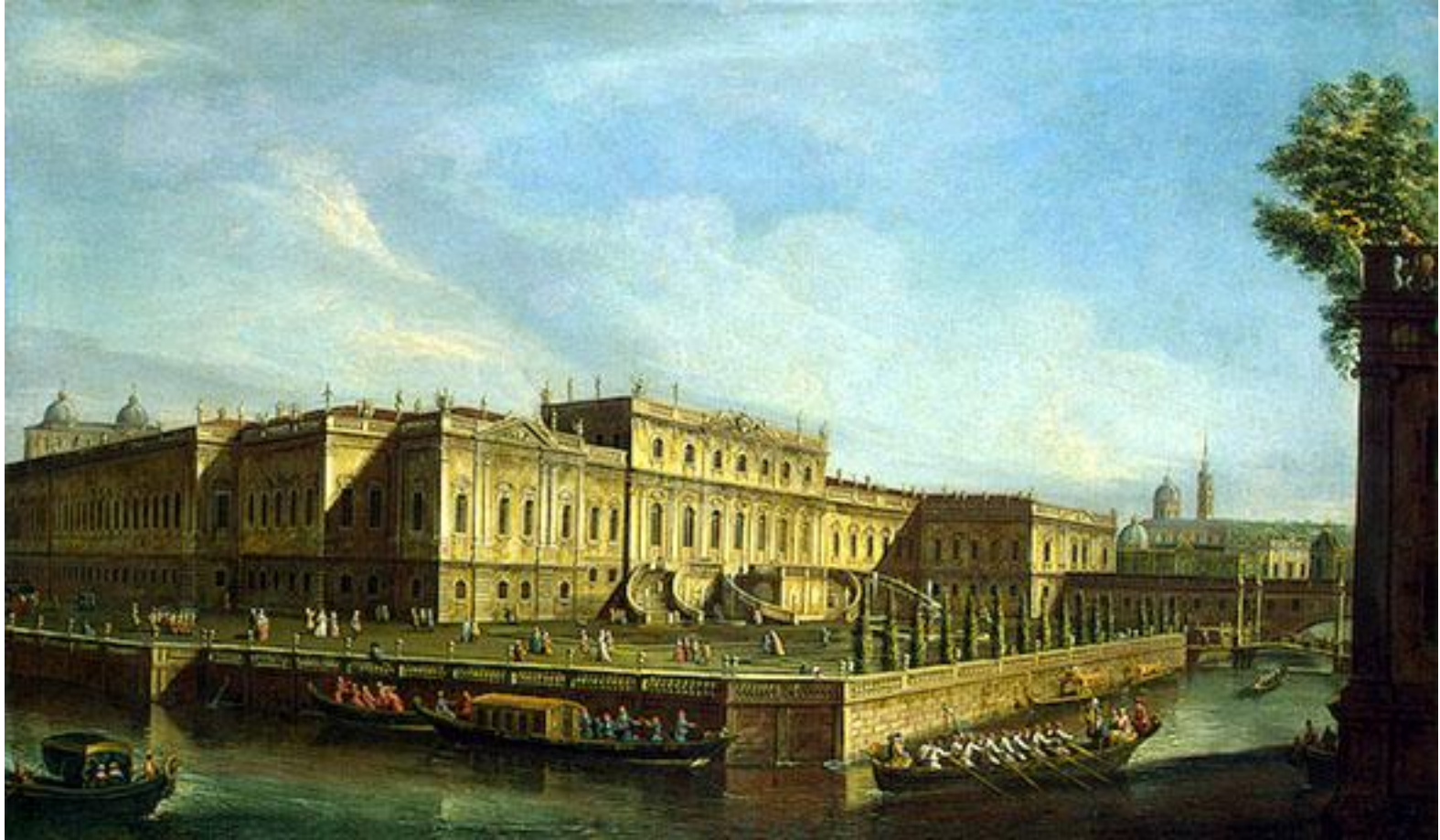
Летний дворец Елизаветы Петровны (построен в 1741, снесён в 1797).