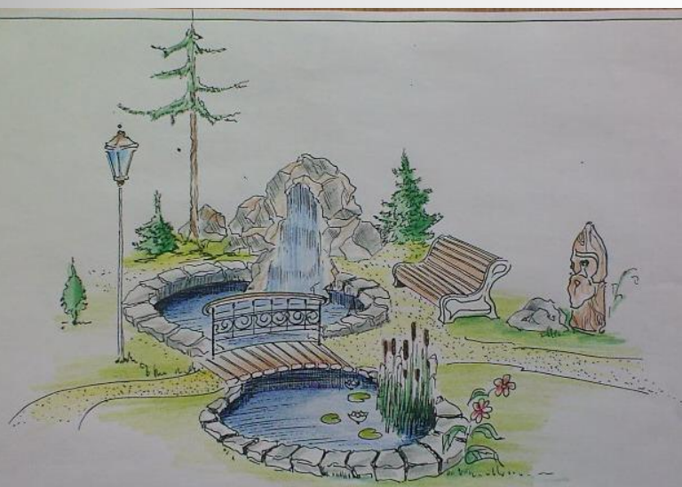
УГОЛОК ЛЯХОГО ОТДЫХА