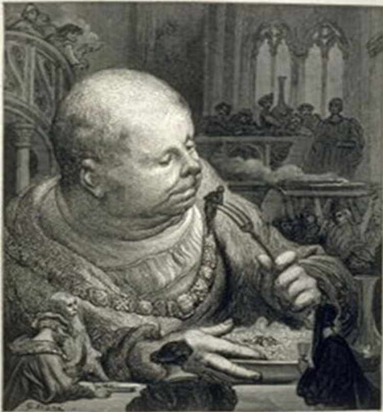
Трапеза Гаргантюа. Иллюстрация Гюстава Доре.