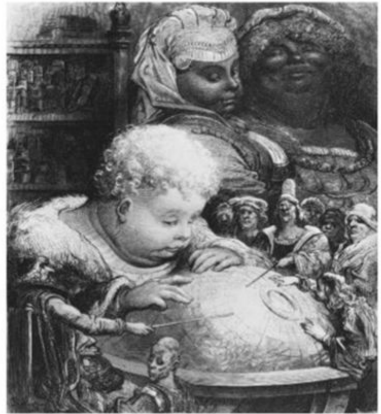
Юный Гаргантюа изучает глобус. Иллюстрация Гюстава Доре.