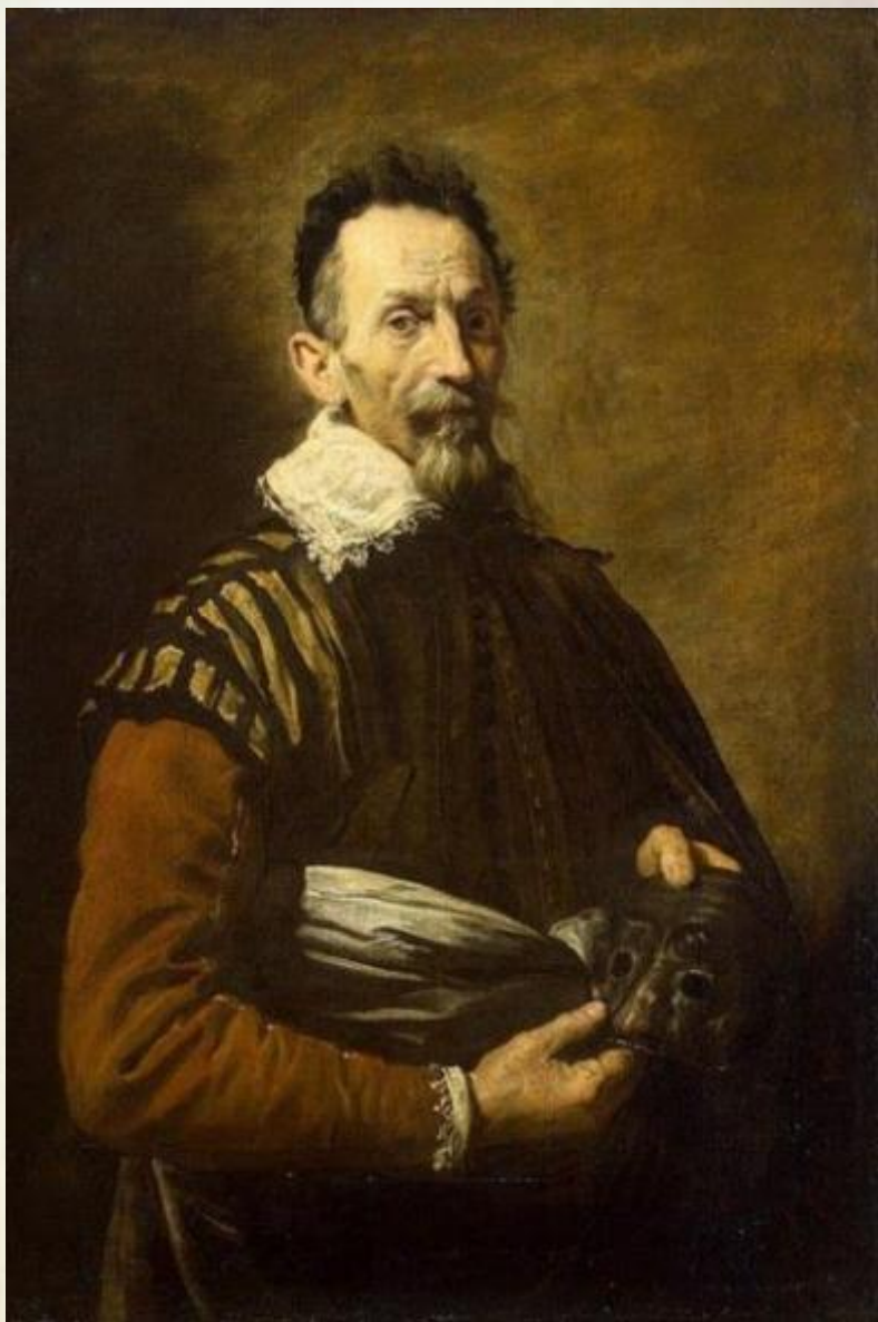
Мигель де Сервантес Сааведра (1547 - 1616)

известен как автор одного из величайших произведений мировой литературы — романа «Дон Кихот».