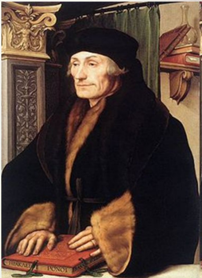
Эразм Роттердамский (1469 - 1536)

С. Цвейг, писатель, биограф гуманиста, назвал гуманиста «славой и светочем своего времени».