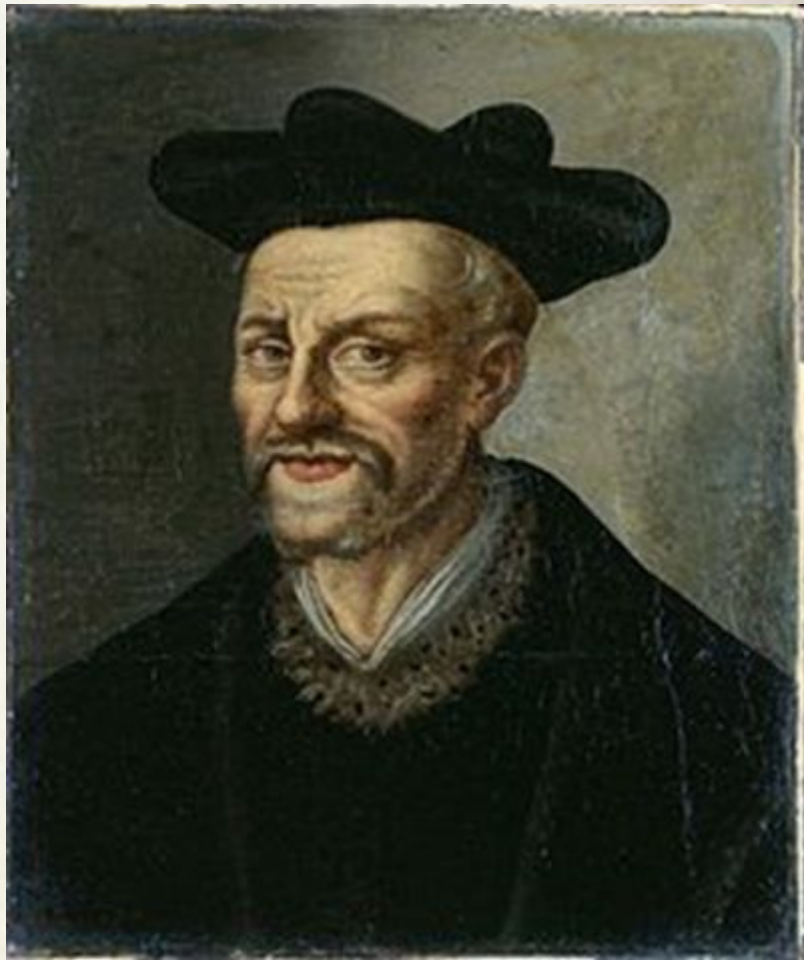
Франсуа Рабле (1494-1553)

Французский писатель, один из величайших европейских сатириков-гуманистов эпохи Ренессанса, автор романа «Гаргантюа и Пантагрюэль»