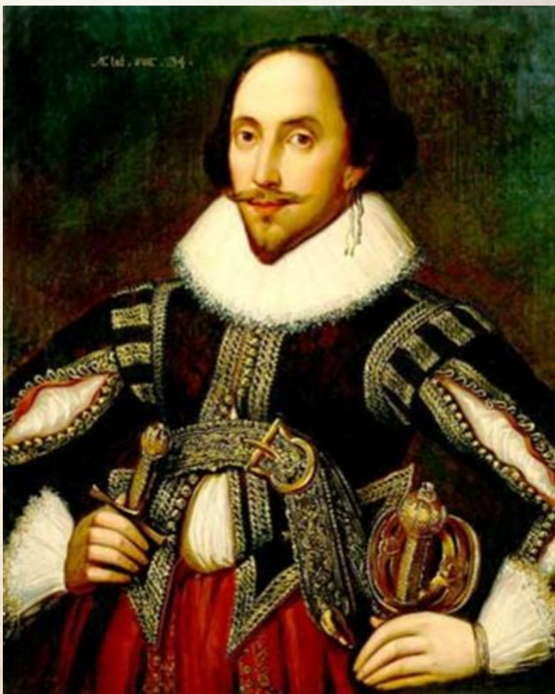
Уильям Шекспир (1564 - 1616)

английский драматург и поэт, один из самых знаменитых драматургов мира, автор по крайней мере 17 комедий, 10 хроник, 11 трагедий, 5 поэм и цикла из 154 сонетов.