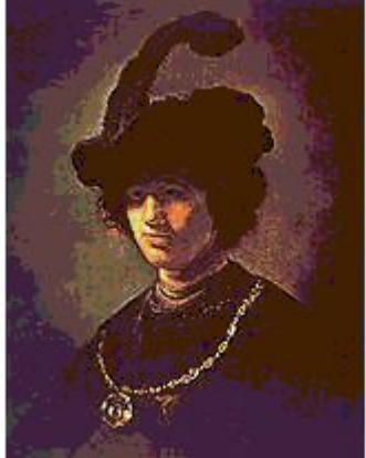
Автопортрет в молодости