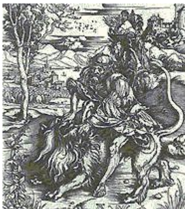
Самсон убивает льва