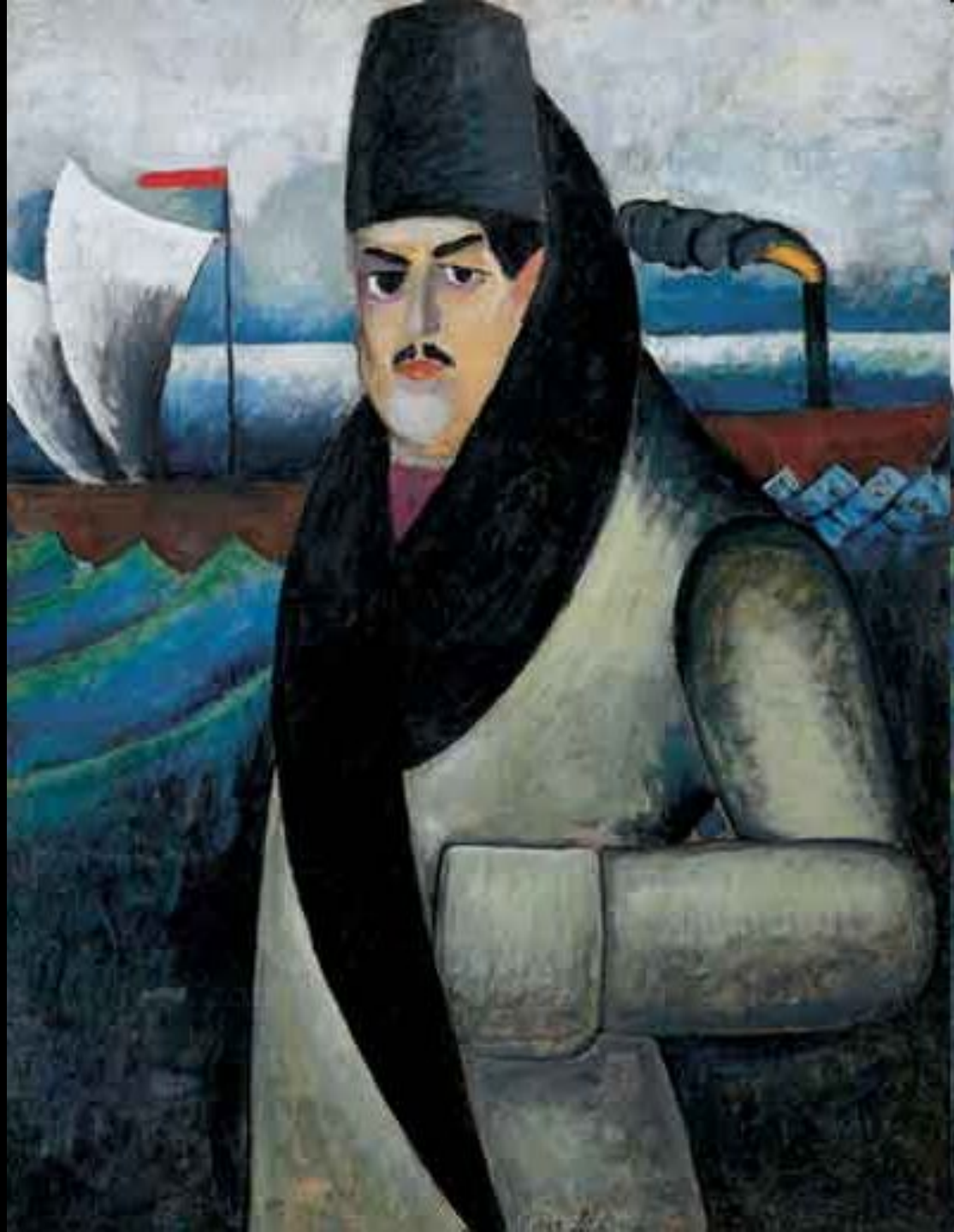
И. Машков Автопортрет. 1911