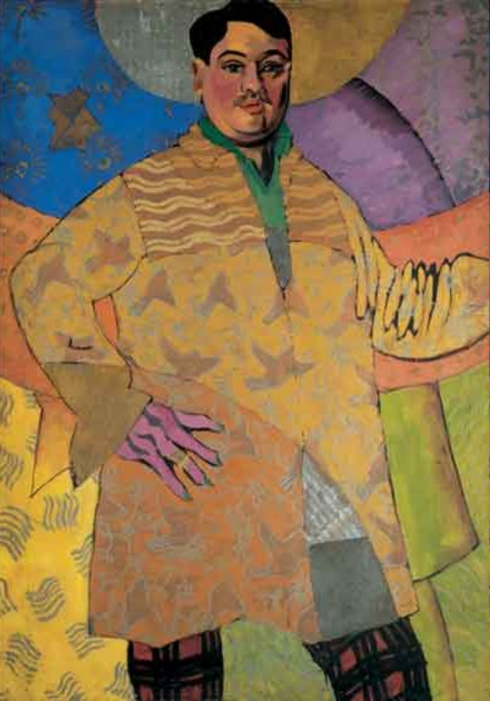
А. Лентулов. Автопортрет 1915