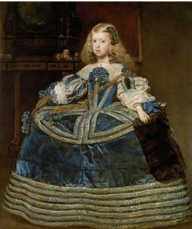
Портрет инфанта Маргариты в трехлетнем возрасте.

Творч. работа (упр.3), стр.13 – описать картину Веласкеса (реферат)