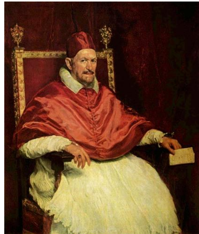
Портрет папы Иннокентия X.