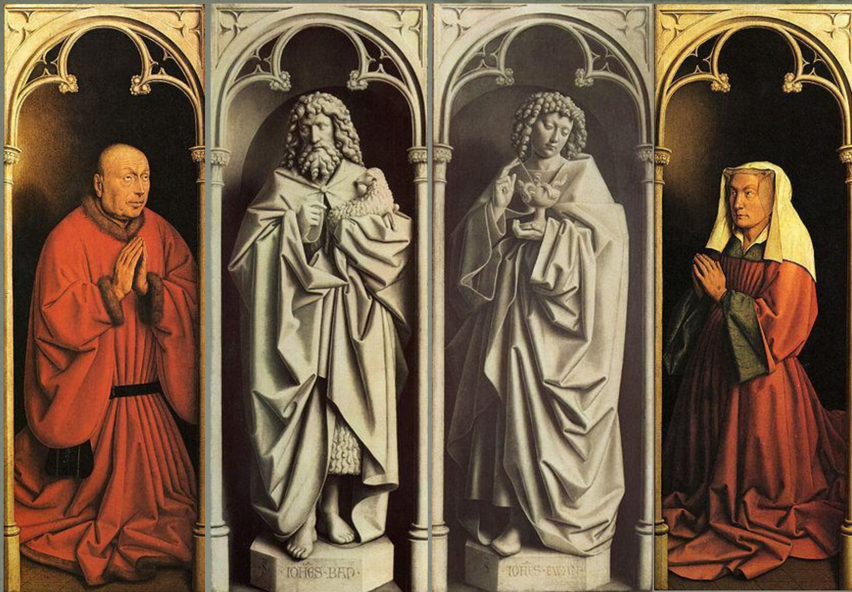
Донатор (заказчик алтаря)