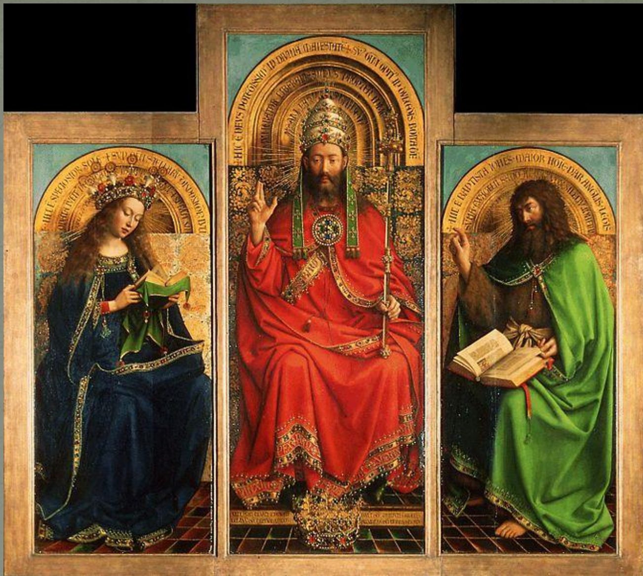
Бог-Отец, сидящий на престоле