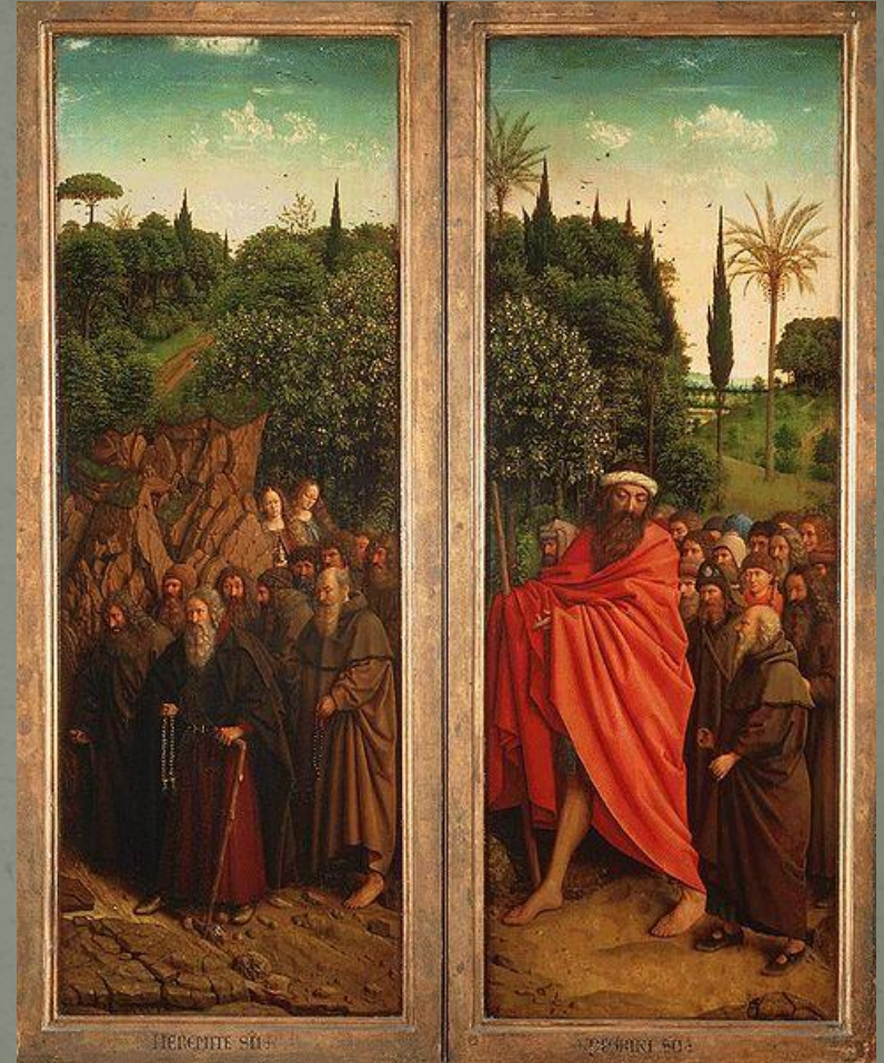
Шествие отшельников и пилигримов