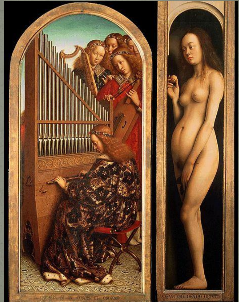
Ангелы и Ева