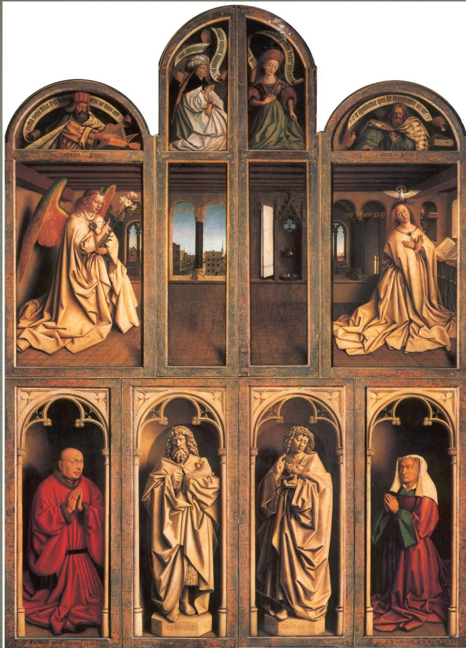
Гентский алтарь в закрытом виде