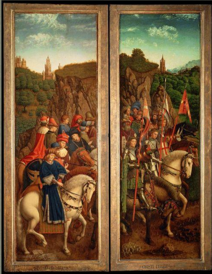
Праведные Судьи и Воинство Христово