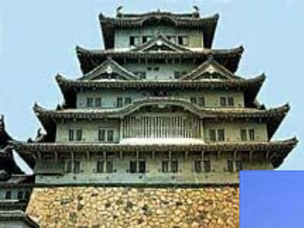
Замок Хакуродзе в Химедзи