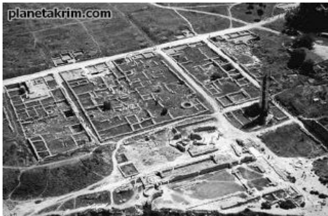
Регулярная, или прямоугольная