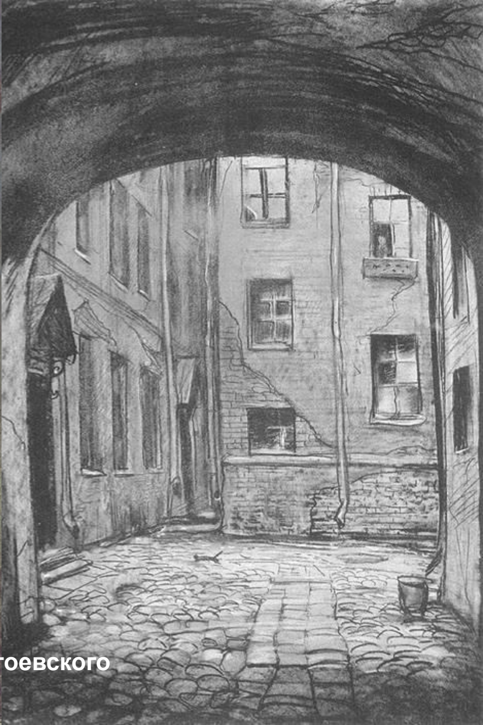
Илья Глазунов Иллюстрации к творчеству Ф.М. Достоевского