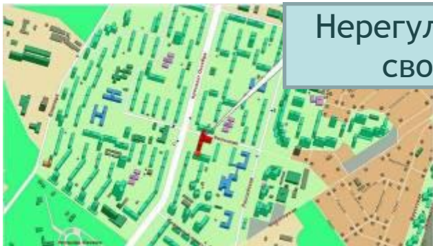
Нерегулярная, или свободная