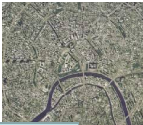
Радиально - кольцевая