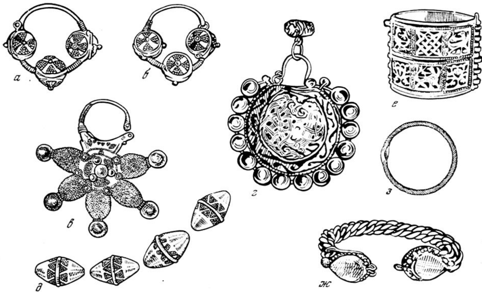
Рис. 16. Украшения горожан:

а, б — височные кольца; в, г — колты; д — бусы; е, ж, з — браслеты