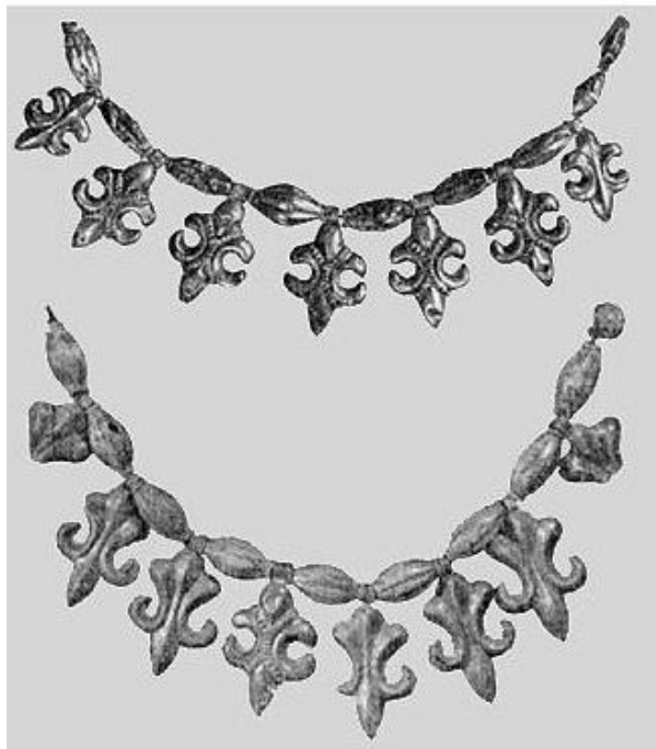
Рис. 109. «КРИНЫ» — УСТОЙЧИВЫЙ СИМВОЛ РАСТИТЕЛЬНОЙ СИЛЫ. ОЖЕРЕЛЬЯ XII—XIII вв. ИЗ КЛАДОВ