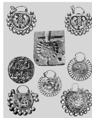
Рис. 110. ГРИФОНЫ И СЕМАРГЛЫ НА СЕРЕБРЯНЫХ КОЛТАХ И НА ИНСТРУМЕНТАХ ДЛЯ ИХ МАССОВОГО ИЗГОТОВЛЕНИЯ. XII—XIII вв.