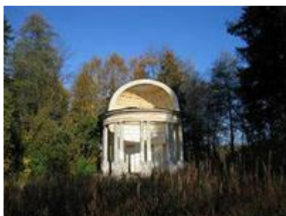
Павильон Орла. Брэнна