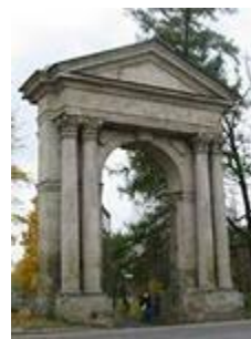
Адмиралтейские ворота. Брэнна