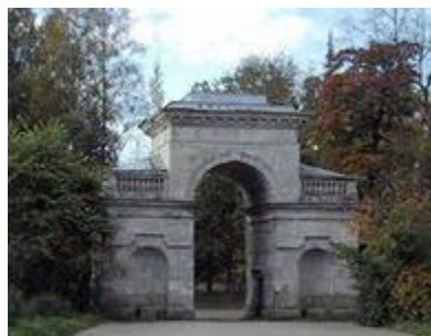
Берёзовые ворота. Брэнна