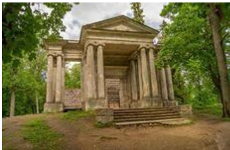
Портал «Маска» Брэнна