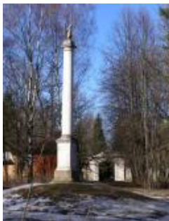
Колонна Орла Ринальди