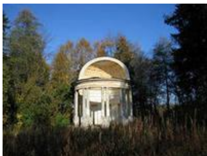
Павильон Орла. Брэнна