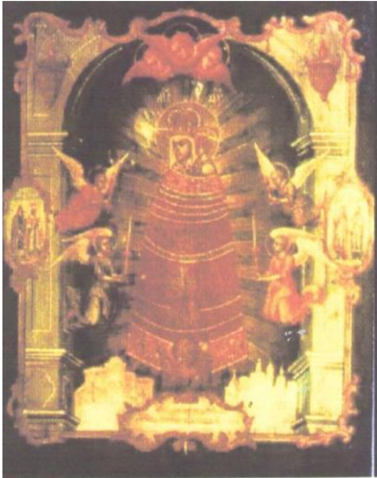
Икона Прибавь ума.