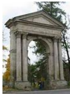
Адмиралтейские ворота. Брэнна