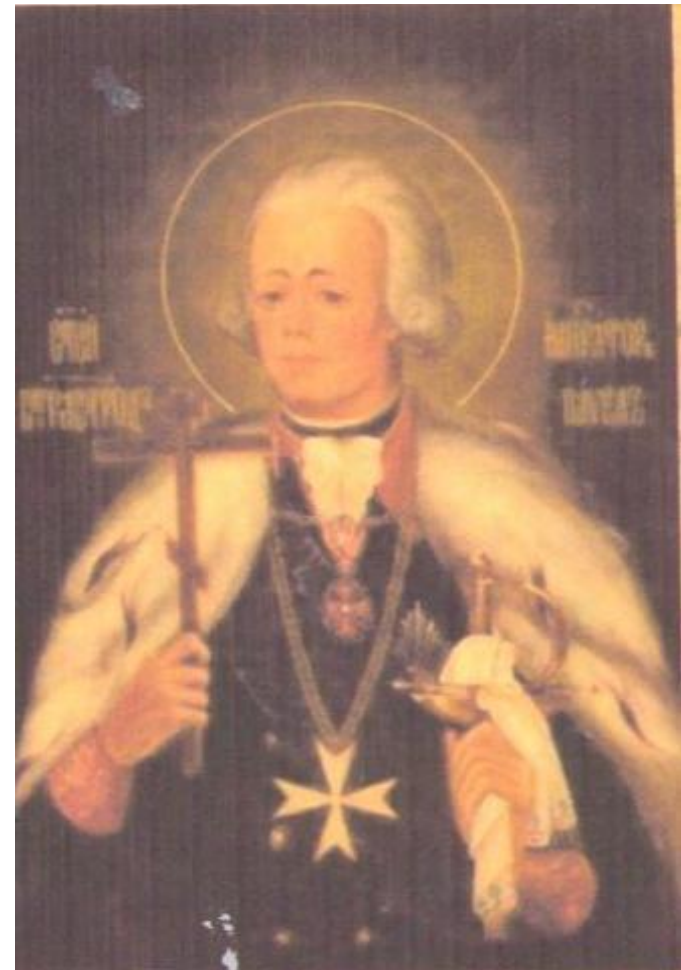
Икона Святого Павла