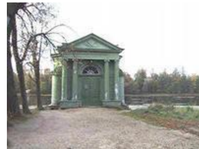
Павильон Венеры. Брэнна