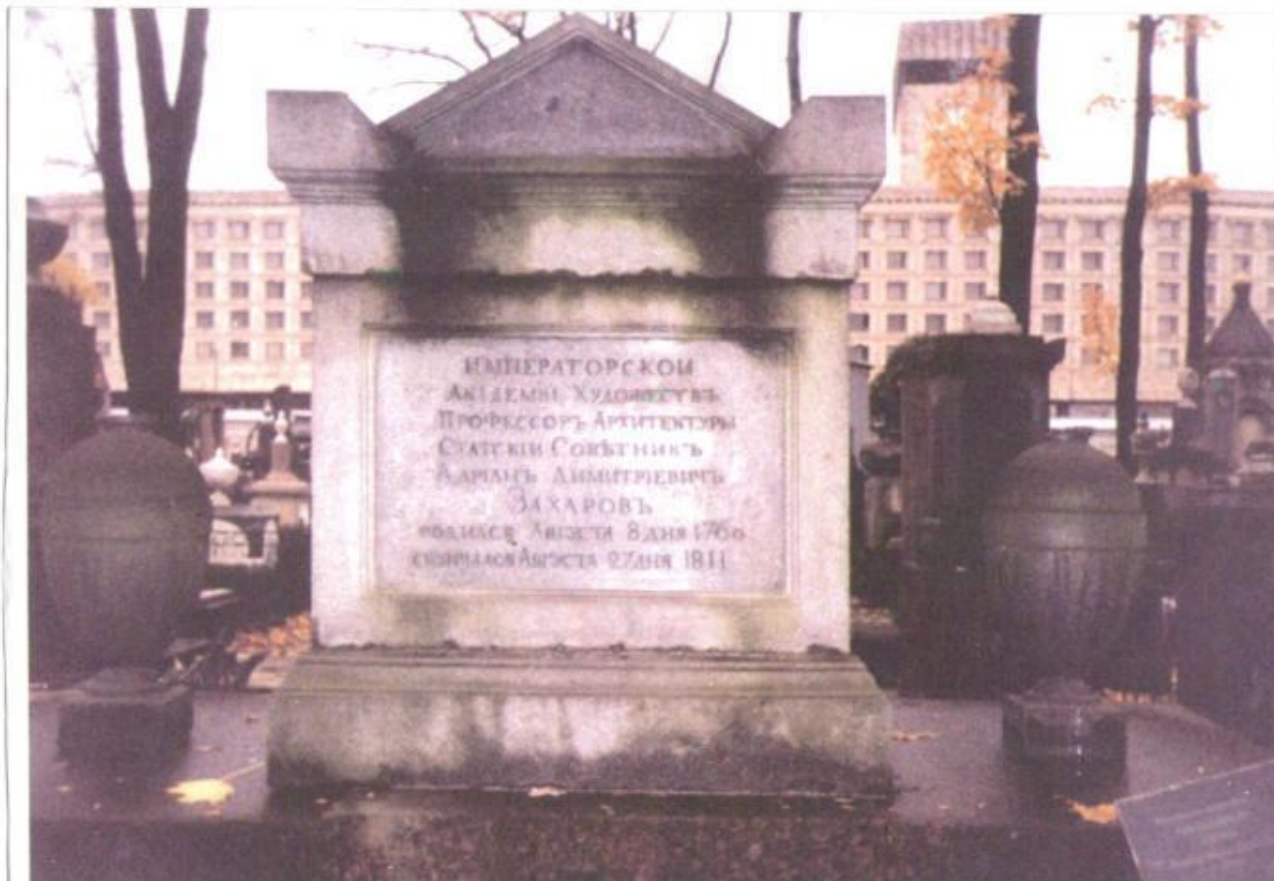
Могила архитектора в Некрополе.