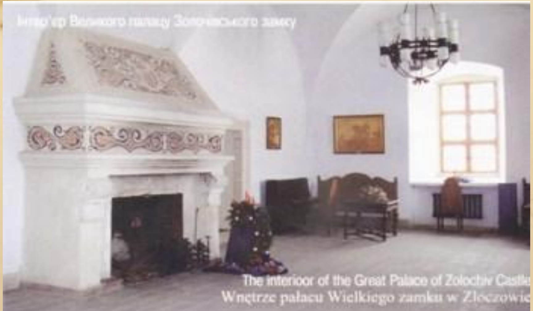
Інтер`єр Великого палацу Золочівського замку