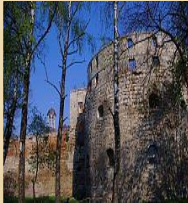
Південний фасад замку в Бережанах