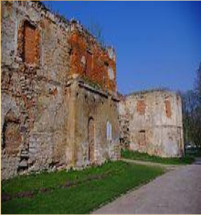
Східна бастея замку в Бережанах