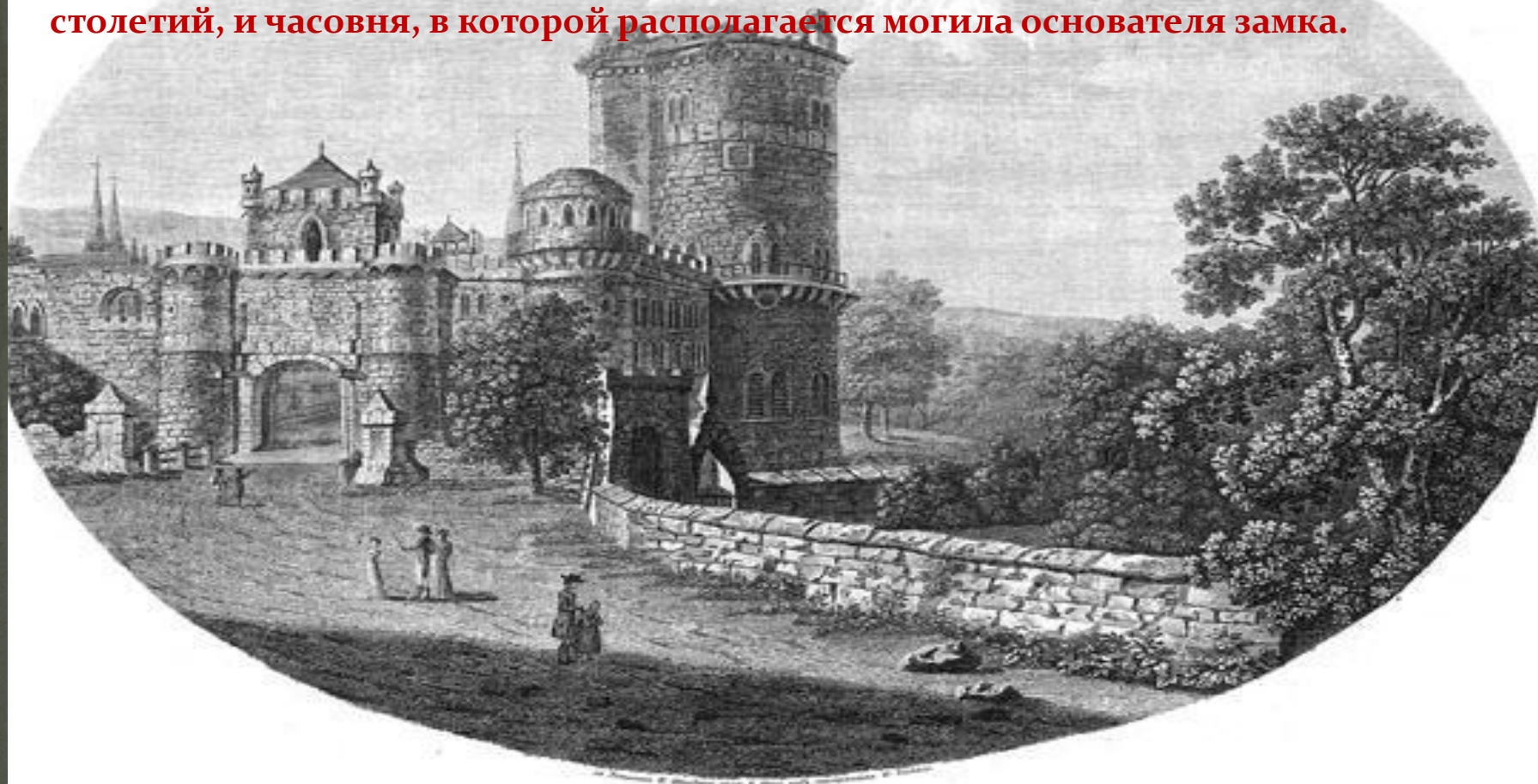
ЗАМОКЪ ЛЕВЕНБУРГЪ, на Вильгельмовой горе близъ Ниссая.

Левенбург – достаточно молодое строение, возведенное в XVII столетии, хотя многие относят его к средневековому замку. Рядом с дворцом располагается оружейная комната, где можно найти оружие и броню XV-XVI столетий, и часовня, в которой располагается могила основателя замка.