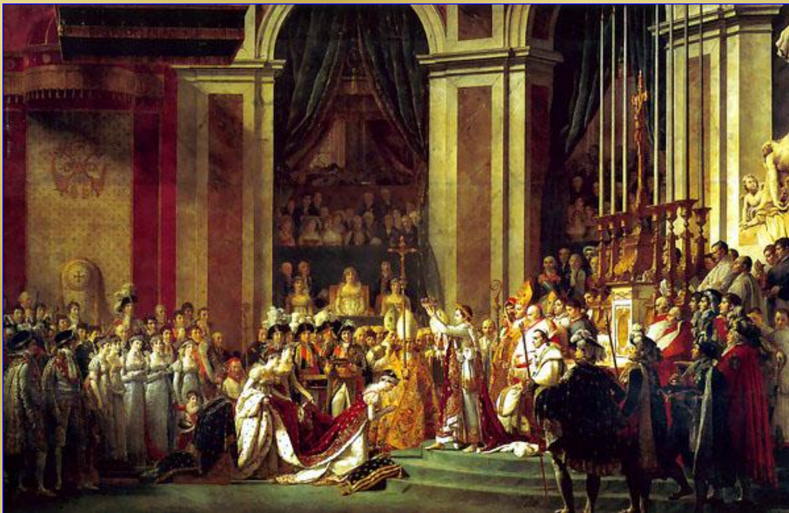
Жак-Луи Давид. Коронация императора Наполеона I и императрицы Жозефины в соборе Парижской Богоматери 2 декабря 1806 года, 1805-1807. Париж, Лувр