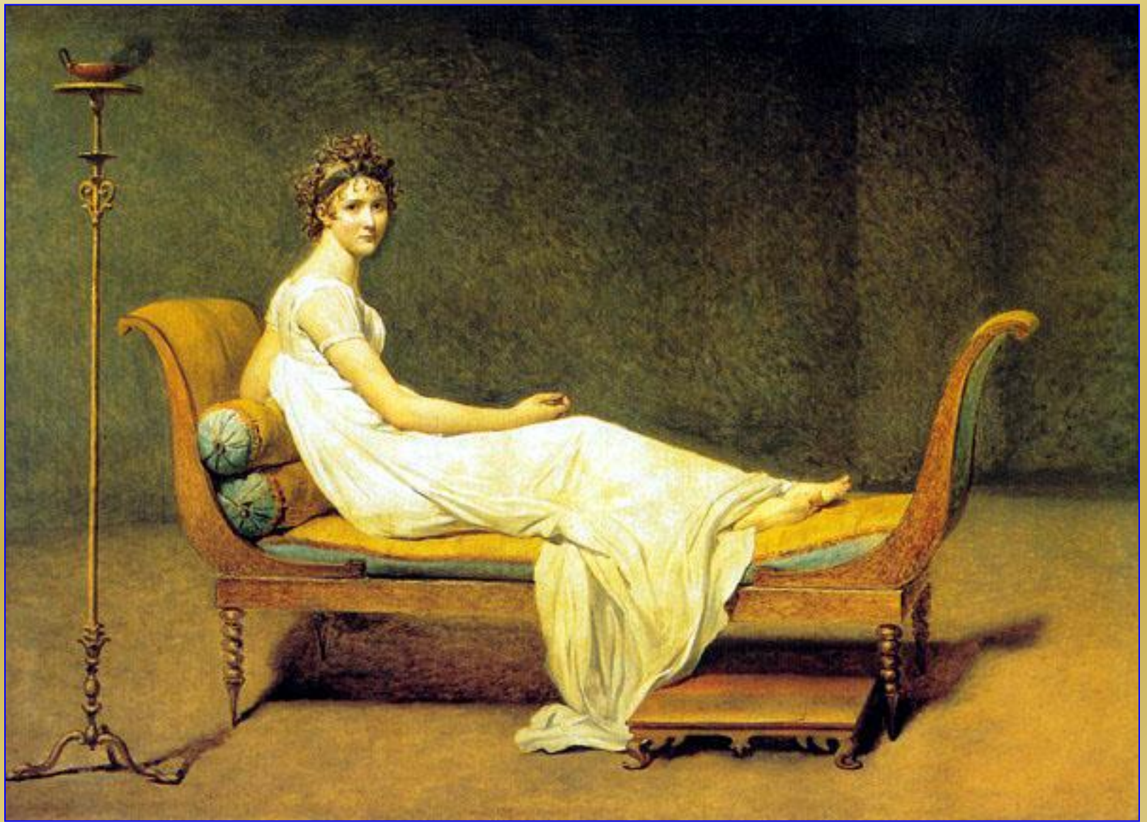
Жак-Луи Давид. Портрет мадам Рекамье, 1800. Париж, Лувр