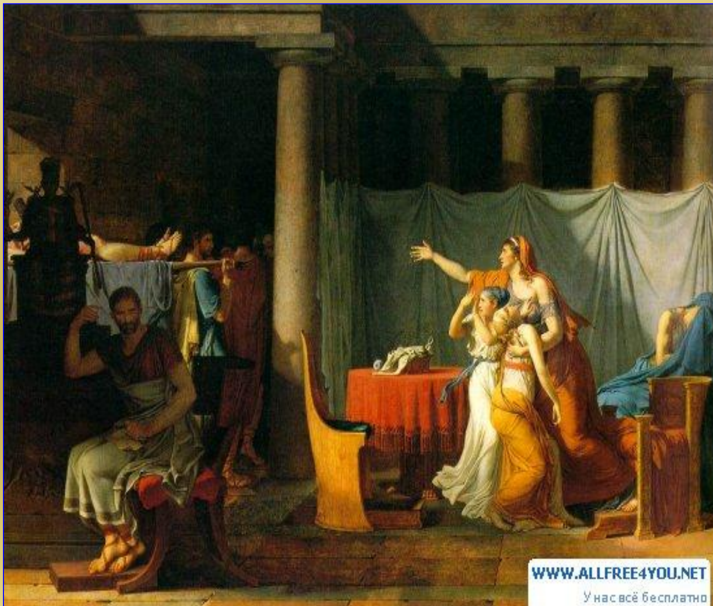
Жак Луи Давид Легионеры приносят Бруту тела казненных сыновей