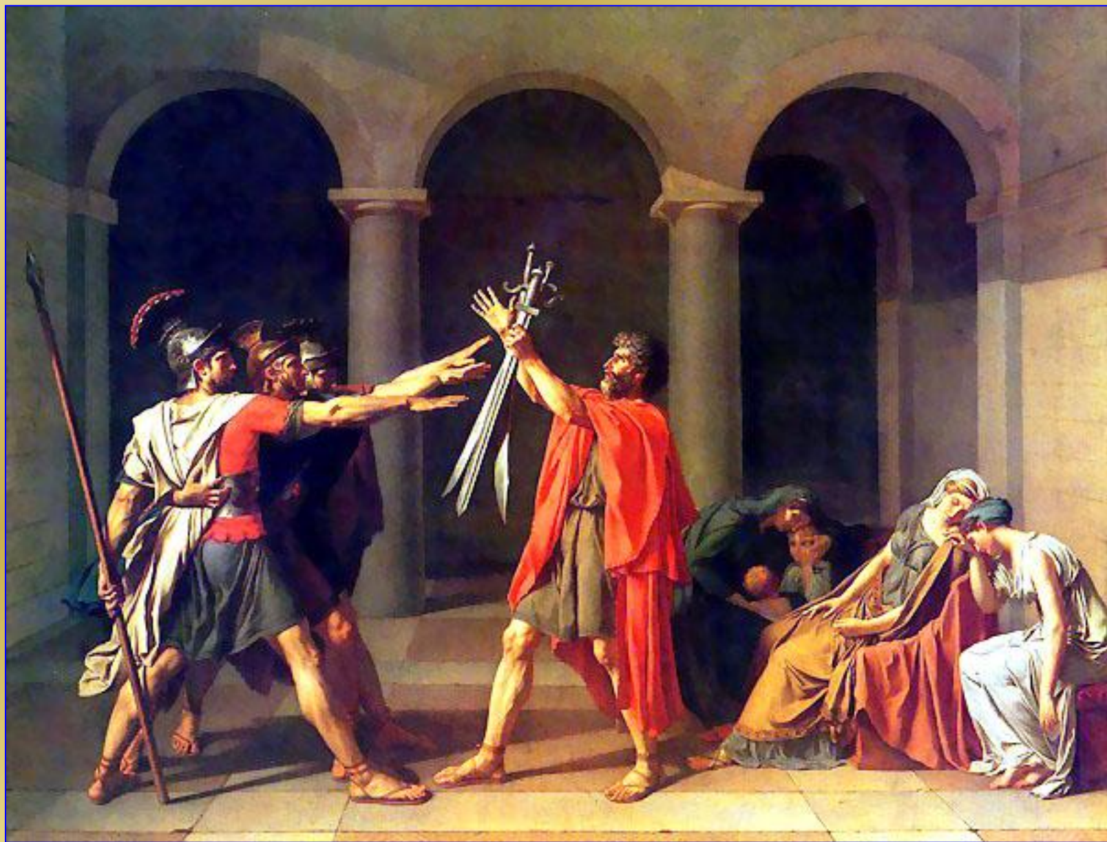
Жак-Луи Давид. Клятва Горацев, 1784. Париж, Лувр