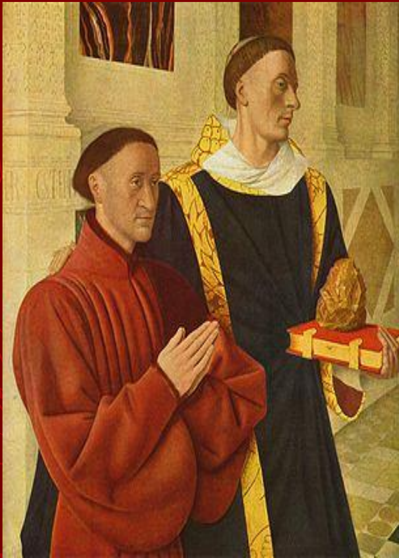
Жан Фуке. Этьена Шевалье и Св. Стефан.

Шедевром Фуке являются миниатюры « Часовая Этьена Шевалье » (1450-1460), не имевшие себе равных по художественным достоинствам. Особенно хороши миниатюры « Благовещение », « Встреча Марии и Елизаветы », и другие, созданные на сюжеты Священного писания. В конце 1450-х гг. мастер создал иллюстрации к сборнику новелл Джованни Боккаччо.