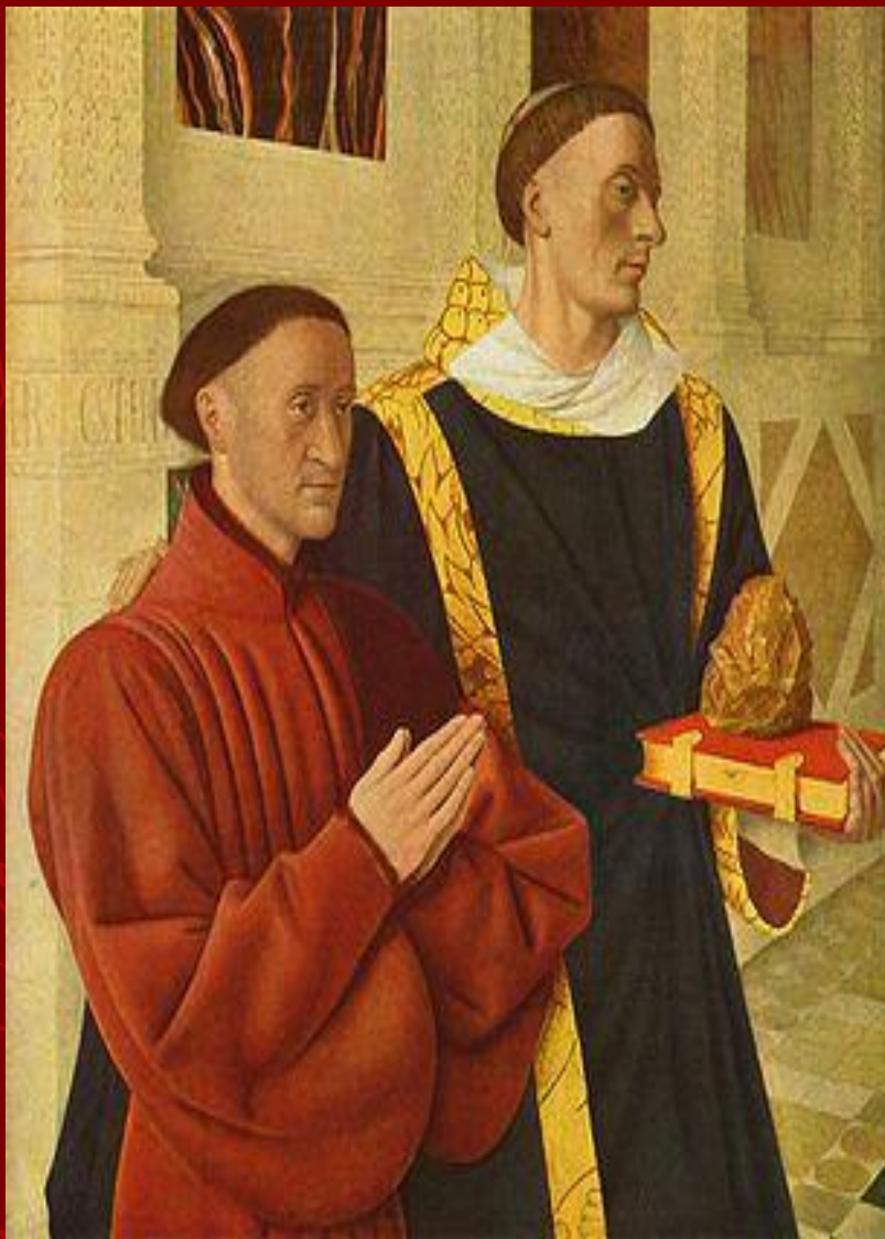
Жан Фуке. Этьена Шевалье и Св. Стефан.

Шедевром Фуке являются миниатюры « Часовая Этьена Шевалье » (1450-1460), не имевшие себе равных по художественным достоинствам. Особенно хороши миниатюры « Благовещение », « Встреча Марии и Елизаветы », и другие, созданные на сюжеты Священного писания. В конце 1450-х гг. мастер создал иллюстрации к сборнику новелл Джованни Боккаччо.