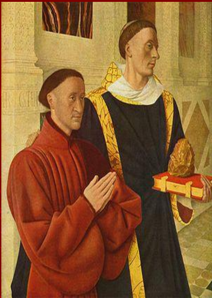
Жан Фуке. Этьена Шевалье и Св. Стефан.

Шедевром Фуке являются миниатюры « Часовая Этьена Шевалье » (1450-1460), не имевшие себе равных по художественным достоинствам. Особенно хороши миниатюры « Благовещение », « Встреча Марии и Елизаветы », и другие, созданные на сюжеты Священного писания. В конце 1450-х гг. мастер создал иллюстрации к сборнику новелл Джованни Боккаччо.