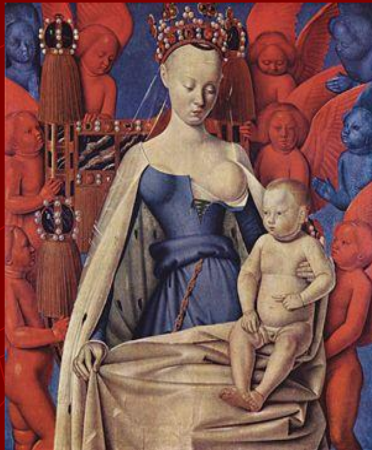
Жан Фуке . Дева Мария

К значительным произведениям Художника можно отнести «Меленский диптих» (ок. 1451-1456), заказанный Фуке Этьеном Шевалье для церкви в его родном городе Мелене.