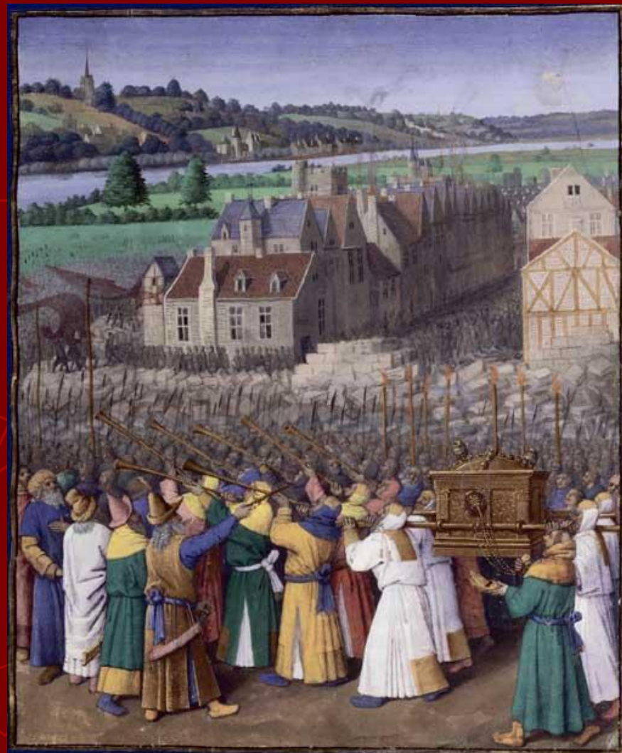
Жан Фуке. «Взятие Иерихона»

Великолепны его миниатюры к рукописи «Больших французских хроник» , заказанных Карлом VII (другая рукопись «Больших французских хроник» проиллюстрирована Симоном Мармионом по заказу герцога Бургундии Филиппа III Доброго). Миниатюры «Хроник» Фуке прославляют французский королевский дом, жизнь которого протекла в пирах и торжественных церемониях ( «Карл Великий Находит тело Роланда» , «Пир в честь Карла IV» , «Коронование Карла Великого» , «Жизнь Людовика II Заики» и др.)