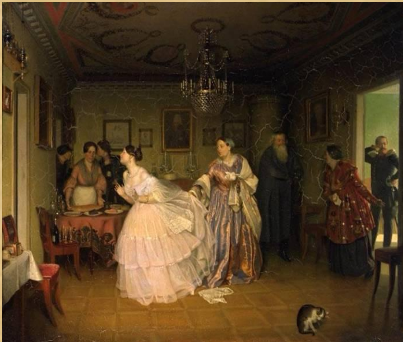
П.Федотов «Сватовство майора» 1848г.

Бытовой жанр – это отражение событий и сцен повседневной жизни