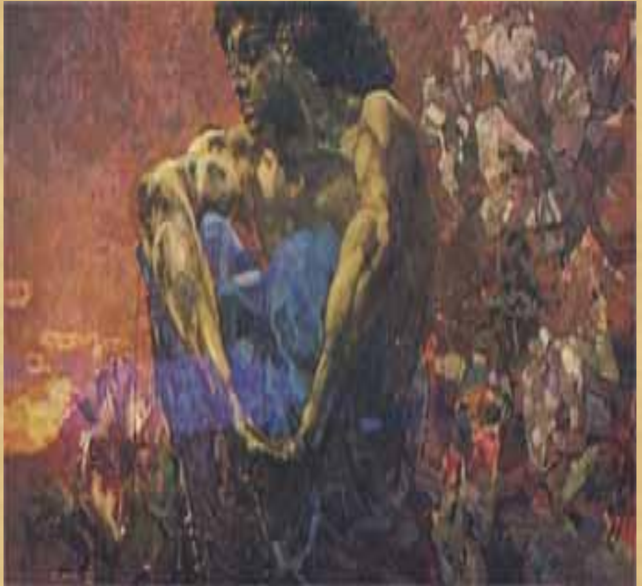
М. Врубель «Демон сидящий» 1890г.

Произведения мифологического жанра черпают сюжеты из мифов различных народов, свободно трактуя легендарные сюжеты.