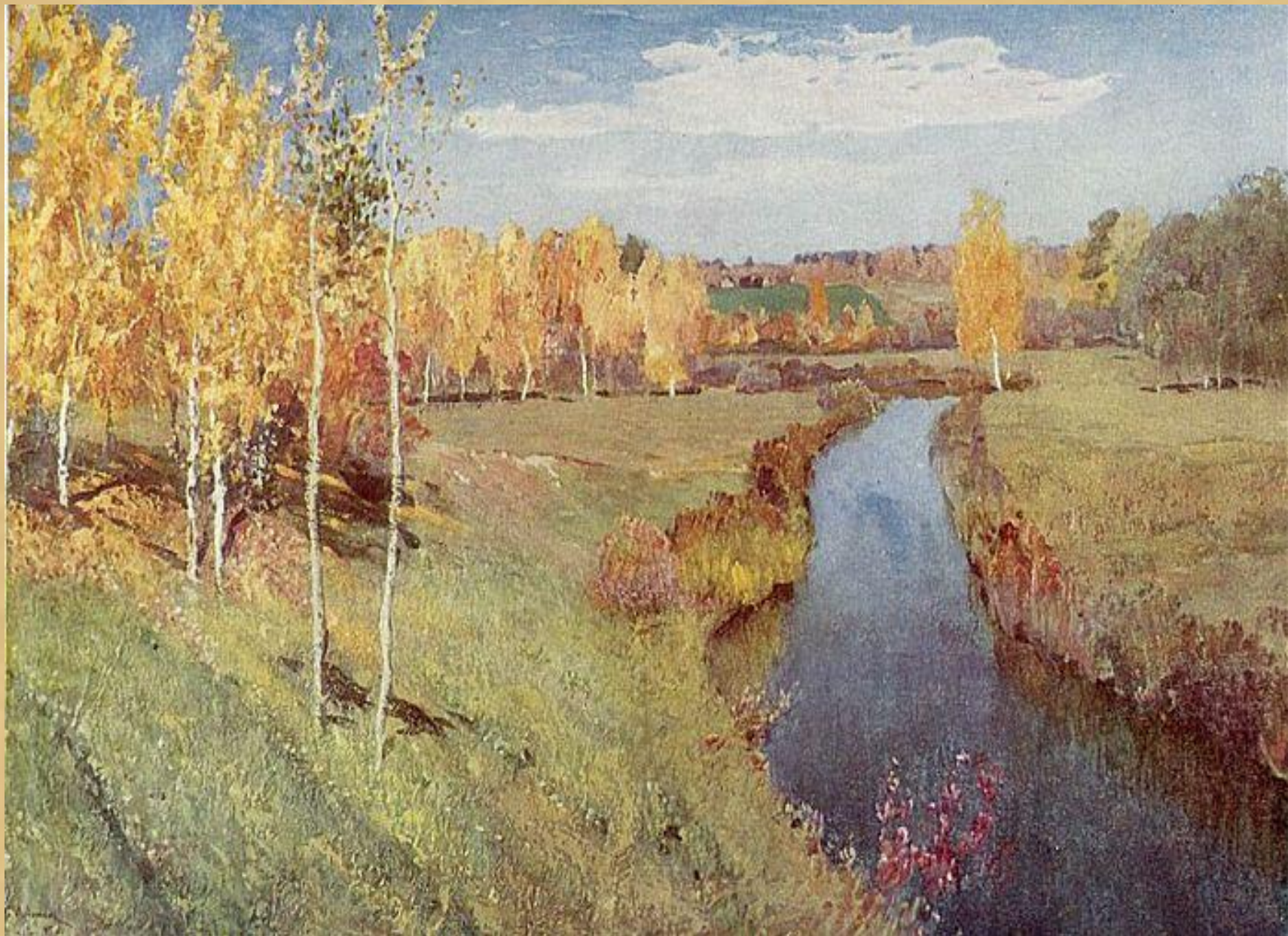
И.Левитан «Золотая осень» 1895г.