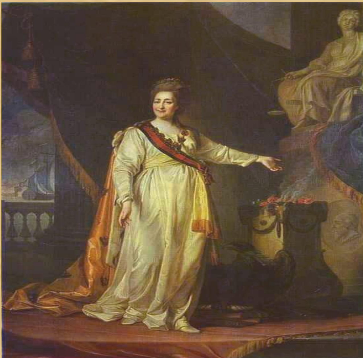
Д.Левицкий. Екатерина II-законодательница в храме богини Правосудия 1783г.