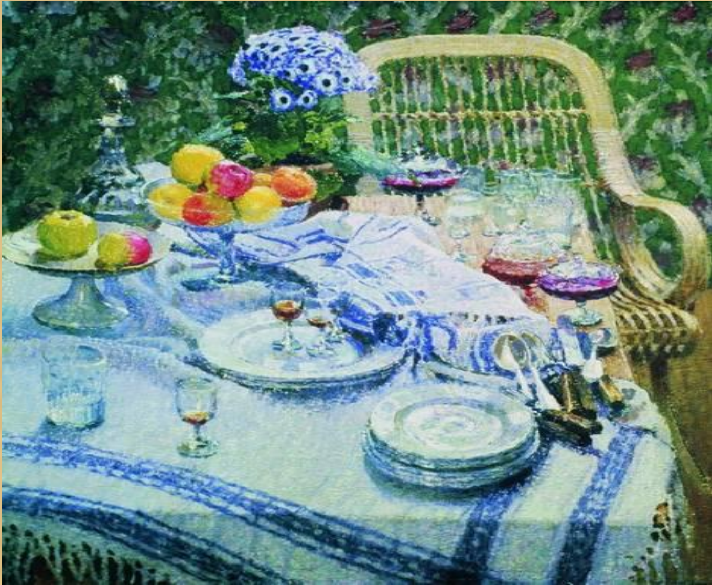
И.Грабарь. Неприбранный стол. 1907г.