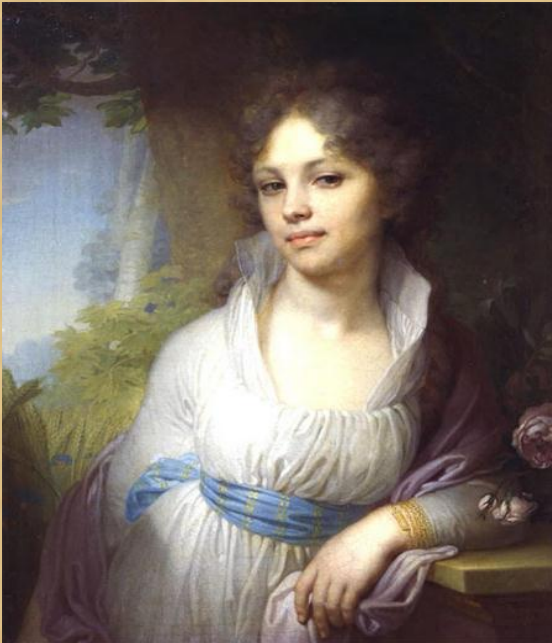
В.Л. Боровиковский . Портрет М.И.Лопухиной 1792 5