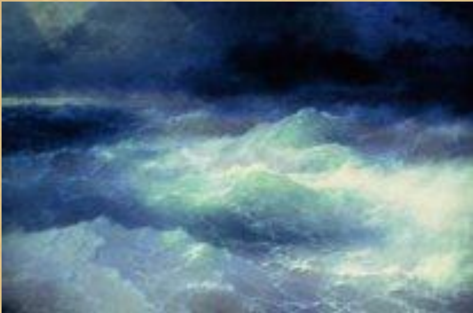
И.Айвазовский. Среди волн.1898г.