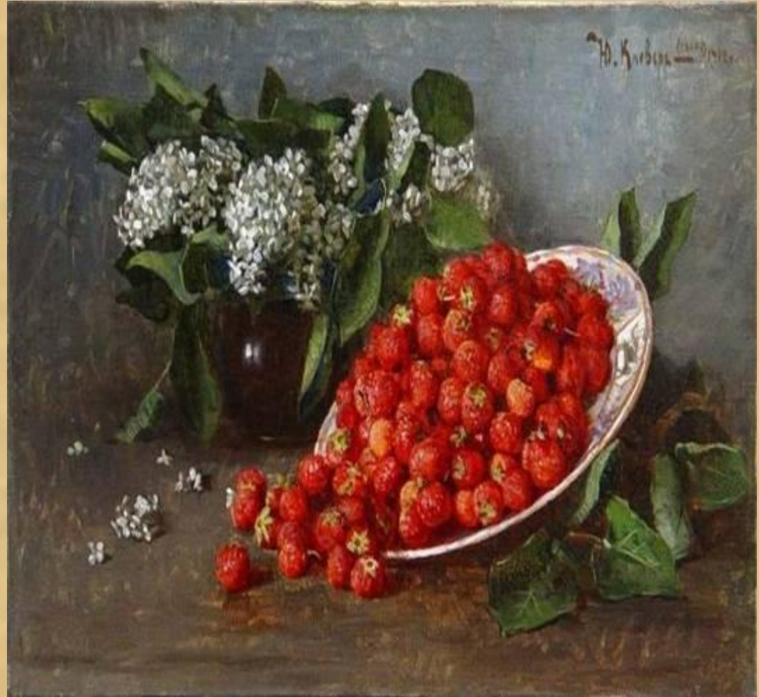
Ю.Клевер. Сирень и клубника 1912г.

От франц. Nature morte- мертвая природа. Натюрморт показывает неодушевленные предметы, организованные в реальной бытовой среде в единую группу.