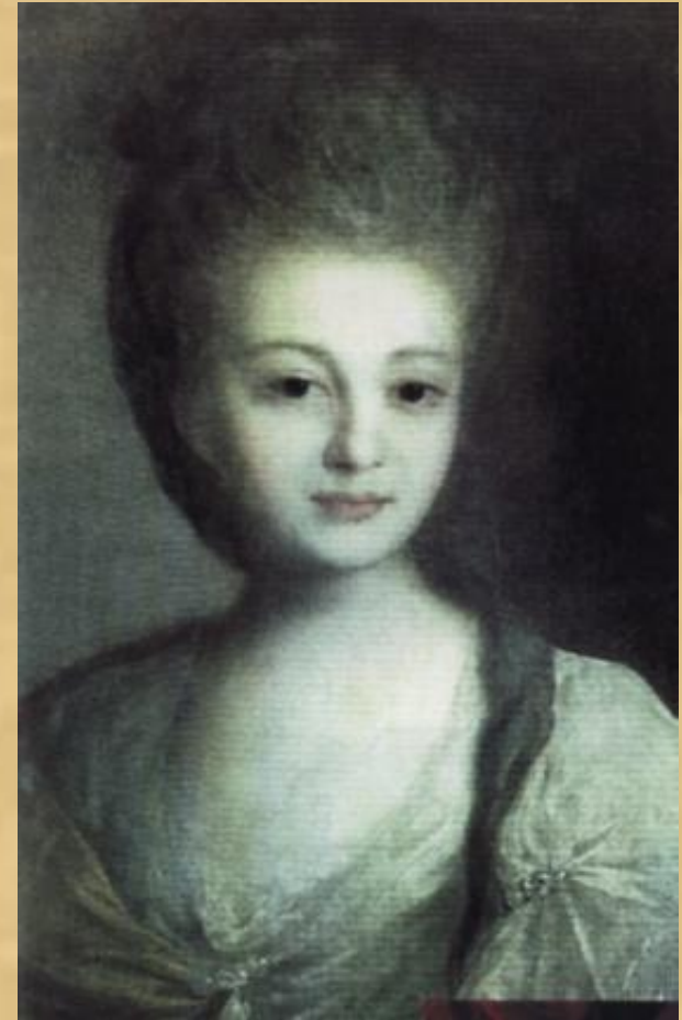
Ф. Рокотов. Портрет А. П. Струйской. 1772г.

Портрет посвящен изображению человека или группы людей. Необходимое требование, предъявляемое ко всякому портрету, - не только передача индивидуального сходства портретируемого, но и его внутреннего мира.