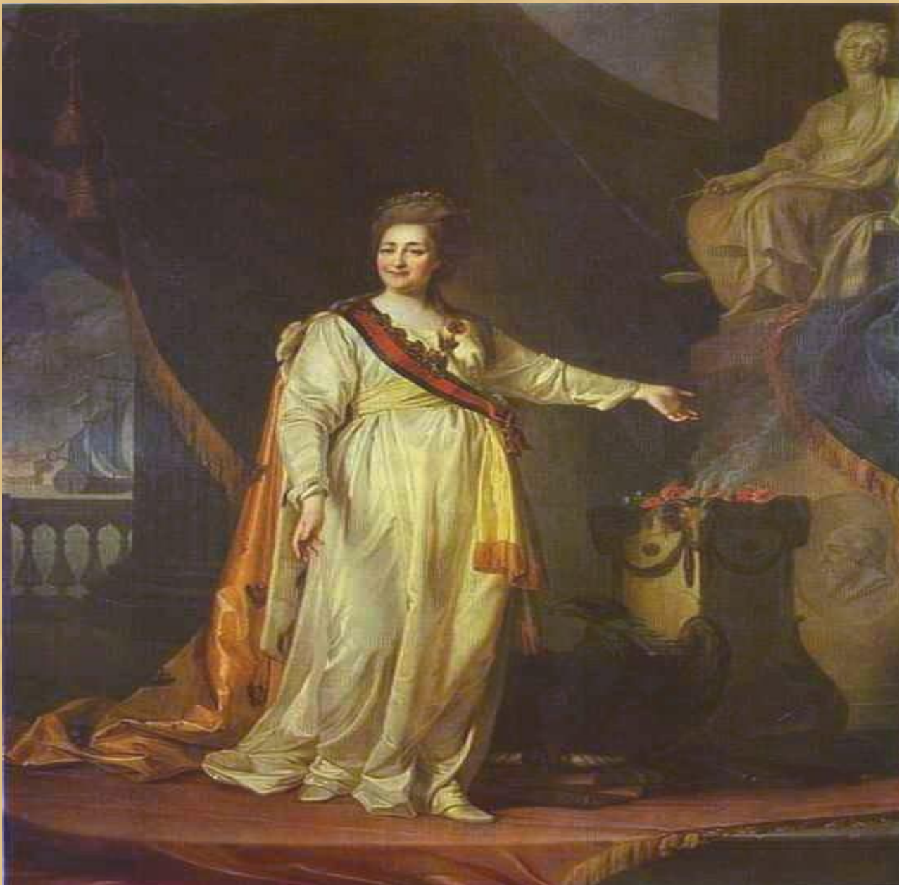
Д.Левицкий. Екатерина II-законодательница в храме богини Правосудия 1783г.