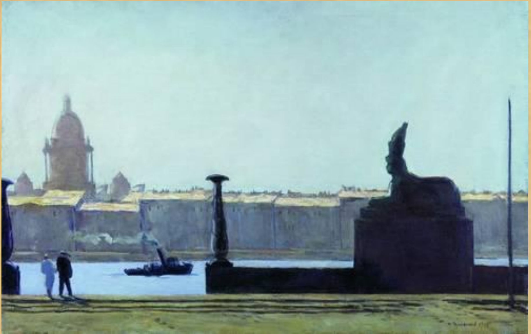
Н.М. Чернышев. Утро на Неве.1890 г.