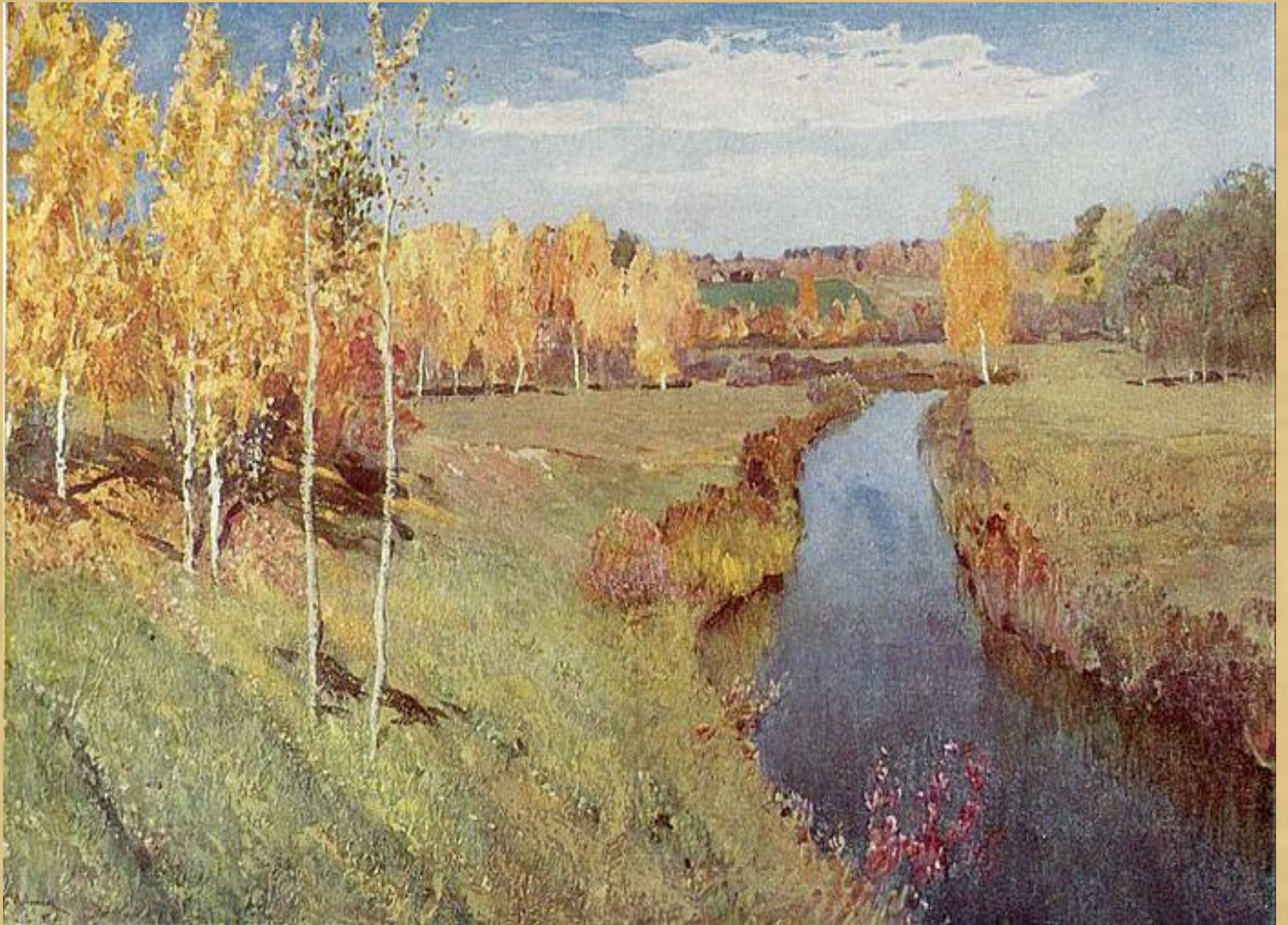
И.Левитан «Золотая осень» 1895г.