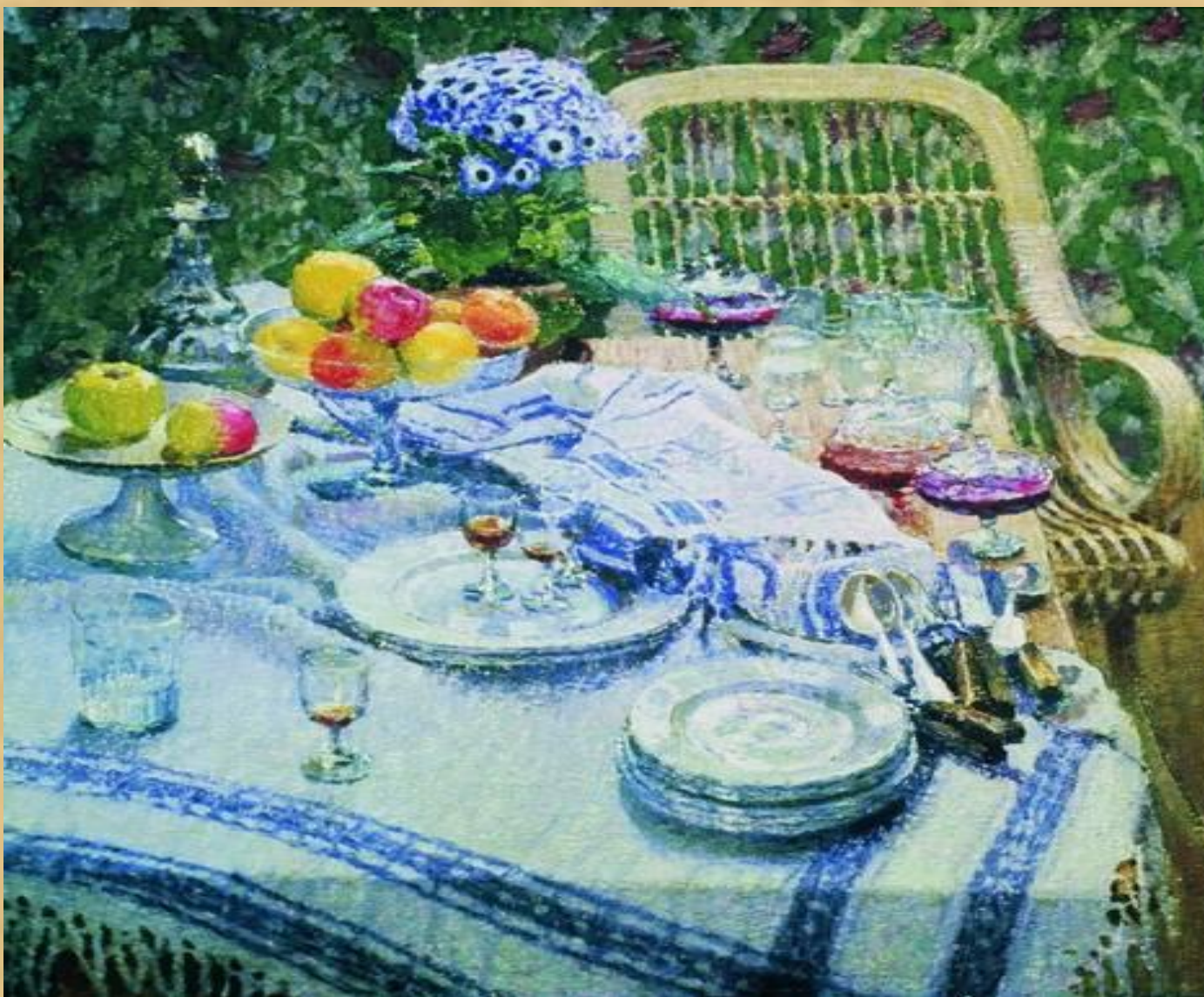
И.Грабарь. Неприбранный стол. 1907г.