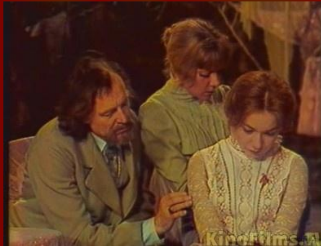
Фильм «Вишневый сад»