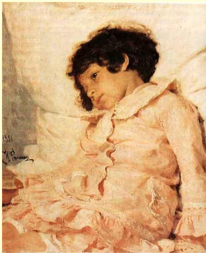
И. Репин. Портрет Нади Репиной.