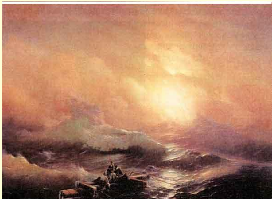
И. Айвазовский. Девятый вал.