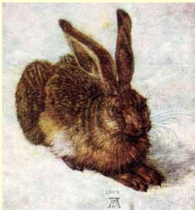
А. Дюрер. Кролик.

Это изображение животных «анимал» (лат.) «животное». Этот жанр возник ещё у первобытных художников. Они изображали сцены охоты на оленей, мамонтов, бизонов. В Россию анималистический жанр пришёл лишь в 19 веке. Художники :Суриков, А. Дюрер, В. Ватагин, В. Сутеев, Е. Чарушин.