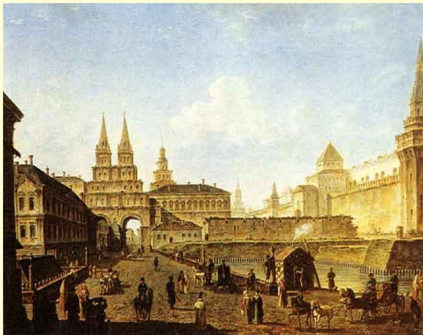
Ф. Алексеев. Вид на Воскресенские и Никольские ворота и Неглинный мост от Тверской улицы.