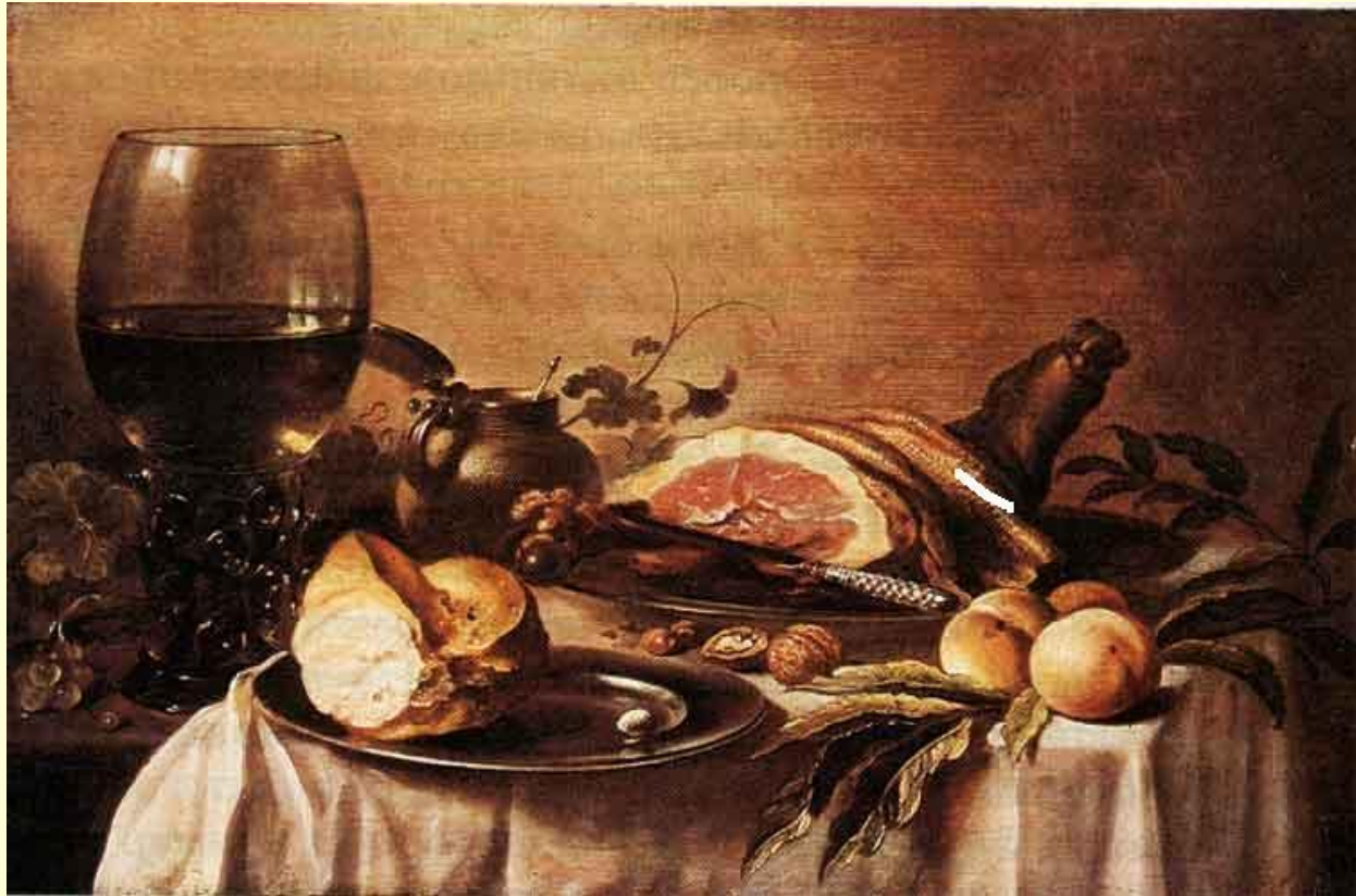
Питер Класс (Голландия). Завтрак с ветчиной.