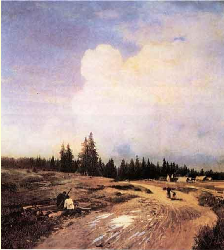
Ф. Васильев. После грозы.