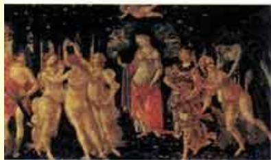
С. Боттичелли. Весна