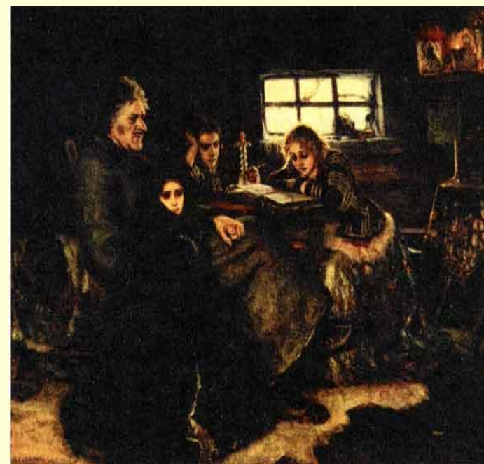
В. Суриков. Меньшиков в Берёзовке