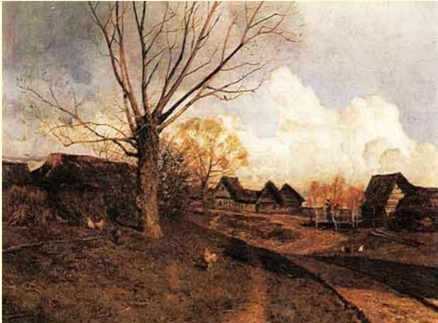
И. Левитан. Саввинская слобода под Звенигородом.