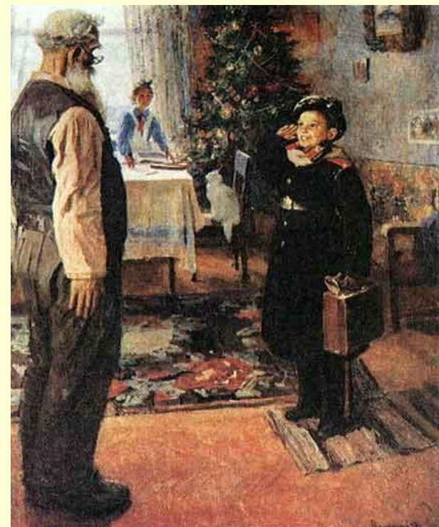
Ф. Решетников. Прибыл на каникулы.

Художники : А. Венецианов, П. Фёдоров, И.Репин, В. Маковский, Б. Кустодиев,