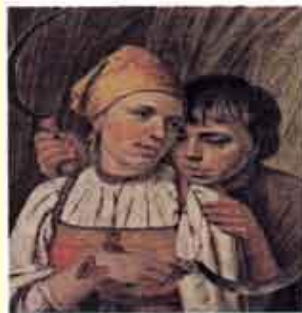
А. Венецианов. Жнецы

Он изображает разные стороны жизни человека: труд и отдых, праздники и будни, забавы и серьезные занятия.