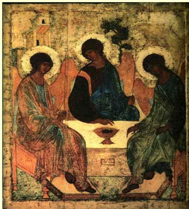
А. Рублёв. Святая Троица.

Известные художники: Леонардо да Винчи, А. Рублёв.