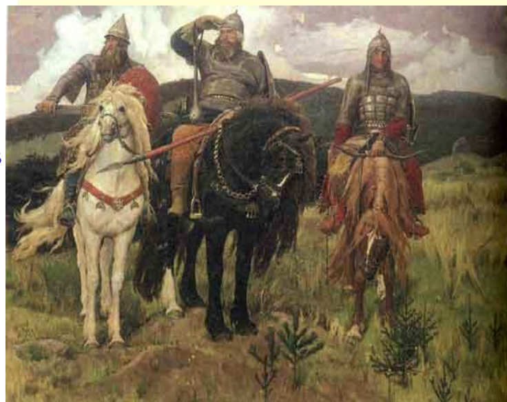
Васнецов. Три богатыря.