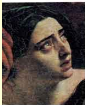
К. Брюллов. Фрагменты картины «Последний день Помпеи».