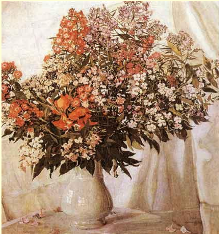
А.Головин. Натюрморт. Цветы в вазе.