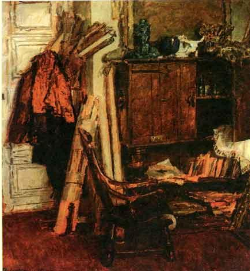
Ф. Решетников. Уголок мастерской.