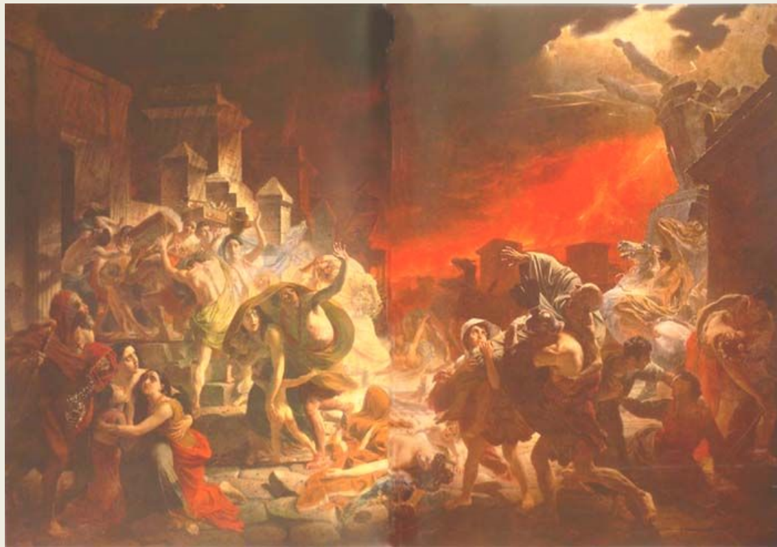
Последний день Помпеи. 1830-1833. Брюлов К.П