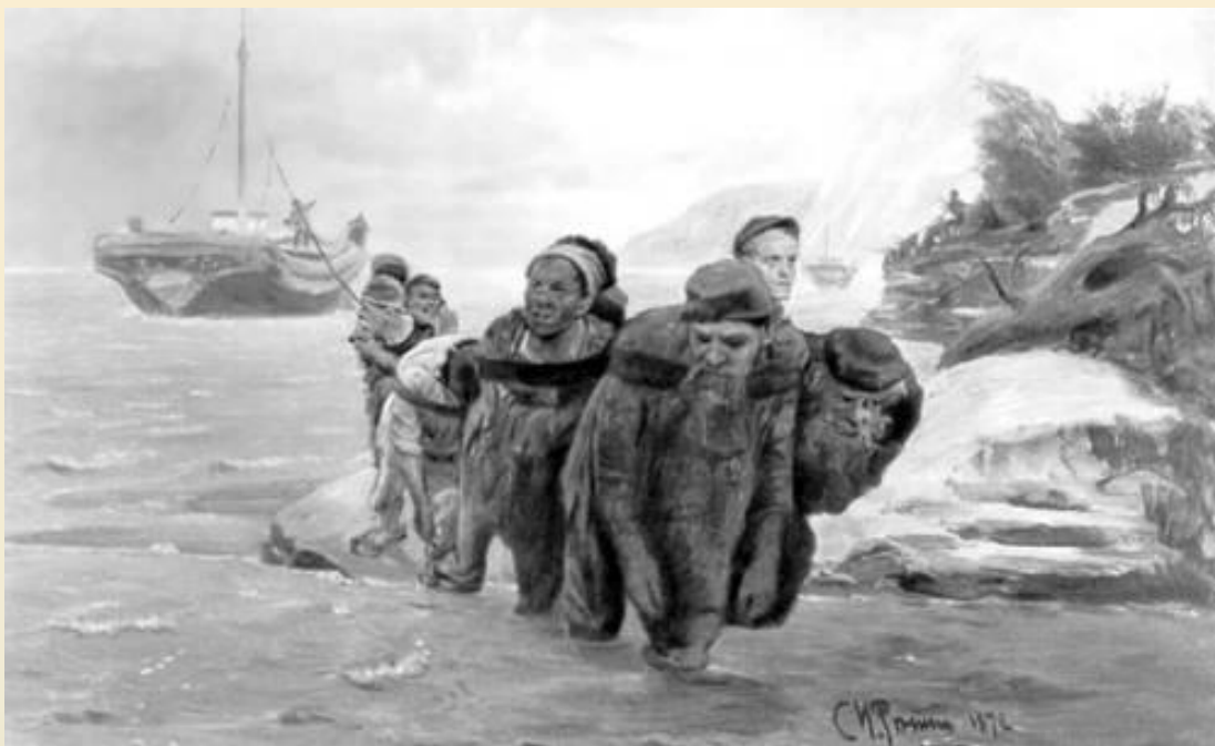
И. Е. Репин. «Бурлаки, идущие в брод». 1872. Третьяковская галерея. Москва.