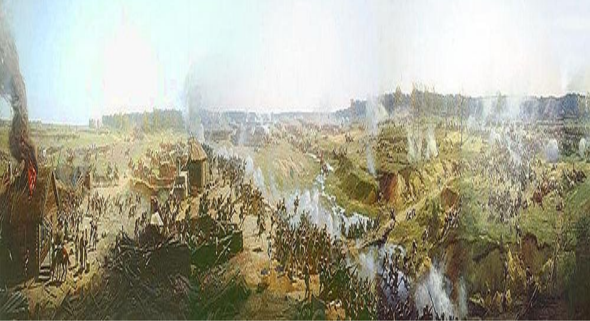
Франц Рубо. Фрагмент панорамы «Бородинская битва». 1812 год