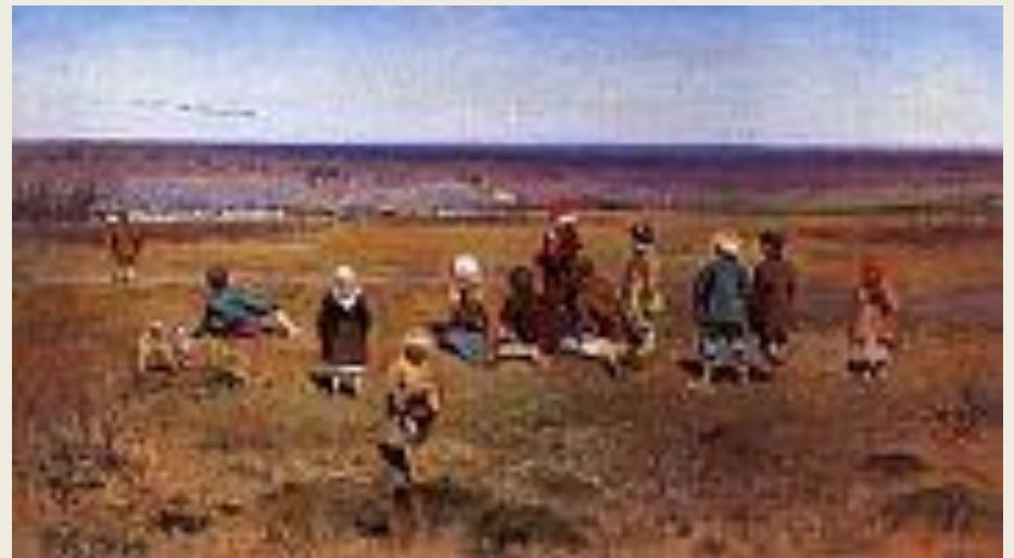
Журавли летят 1891