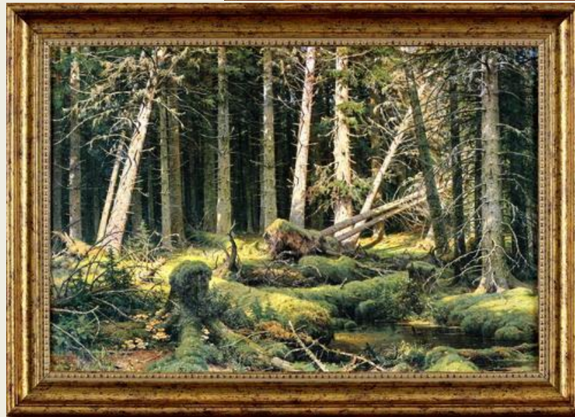
Бурелом. 1888 Шишкин И.И.