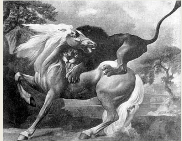
Лев, нападающий на лошадь