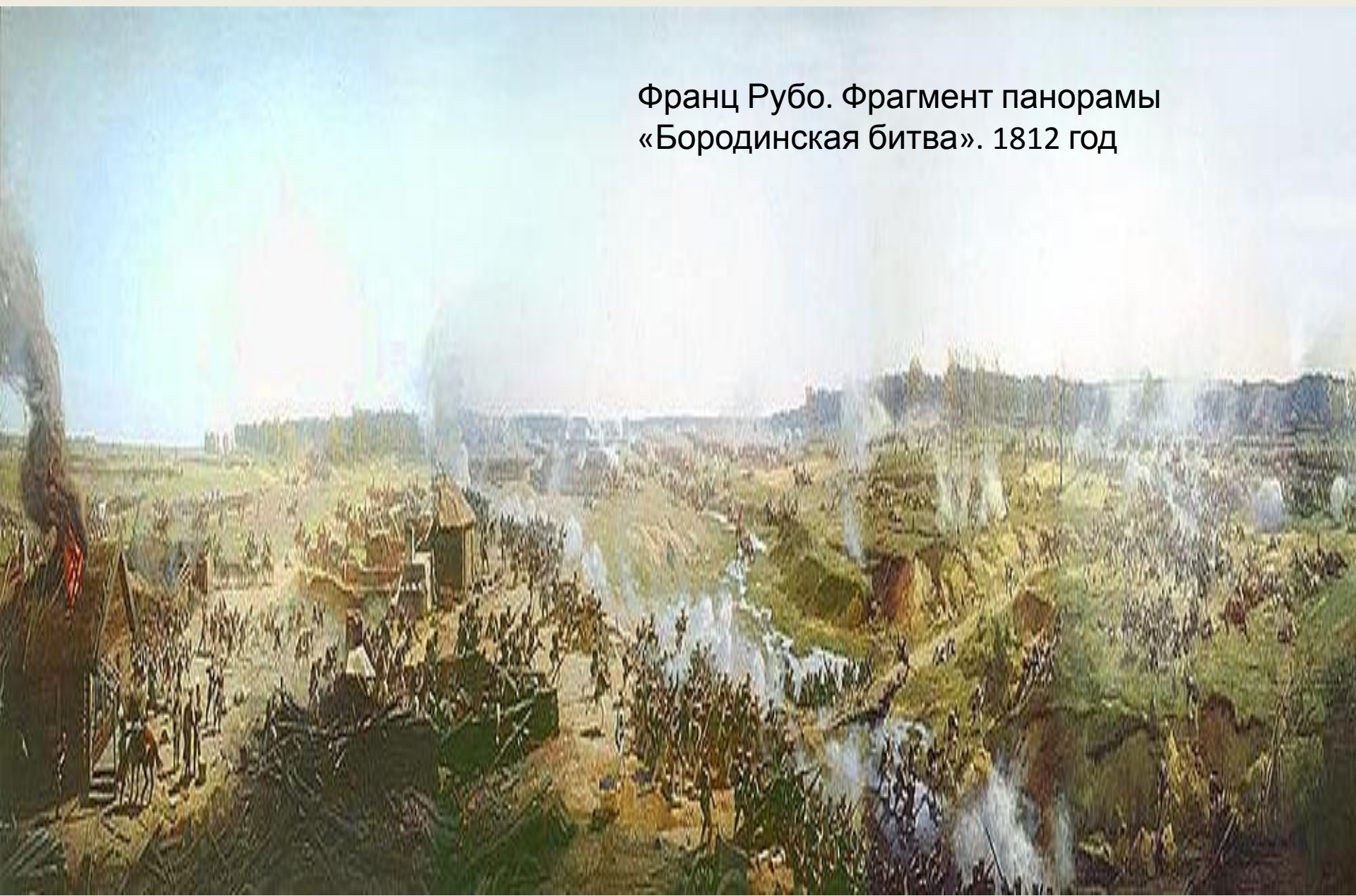
Франц Рубо. Фрагмент панорамы «Бородинская битва». 1812 год