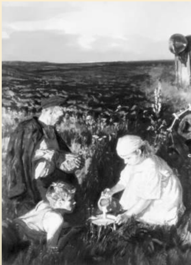
А. А. Пластов. «Ужин трактористов». 1951. Иркутский художественный музей.

Бытовой жанр - жанр изобразительного искусства, посвященный повседневной частной и общественной жизни.