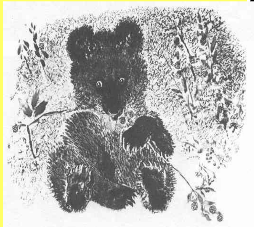
Е. Чарушин. Медвежонок.

Анималистический жанр - жанр изобразительного искусства, посвященный изображению животного мира.