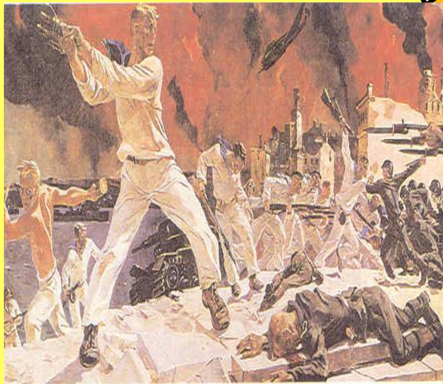
А. Дейнека. Оборона Севастополя.

Батальный жанр - жанр изобразительного искусства, посвященный темам войны и военной жизни. Главное место в батальном жанре занимают сцены военных сражений и походов.