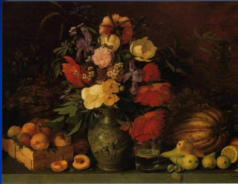
■ И.Хруцкий «Цветы и плоды» 1850-е гг.