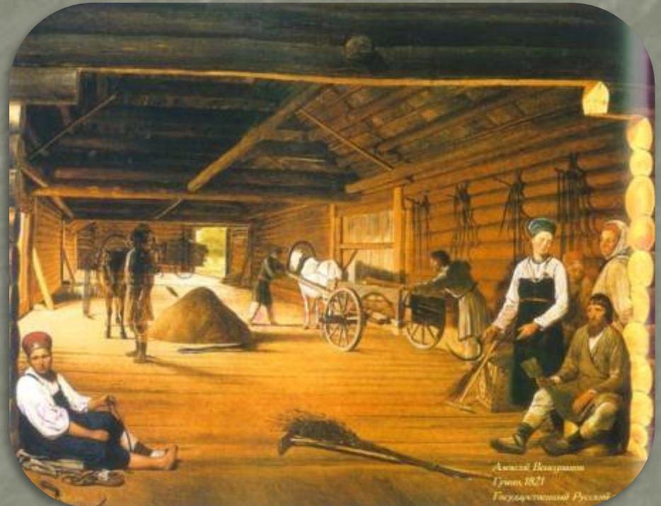
А. Венецианов. Гумно.