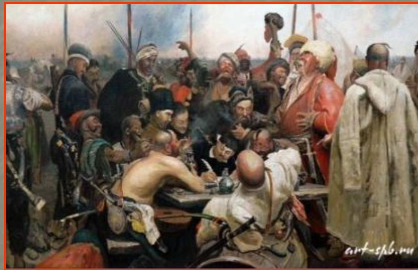
И.Репин «Запорожцы пишут письмо турецкому султану»