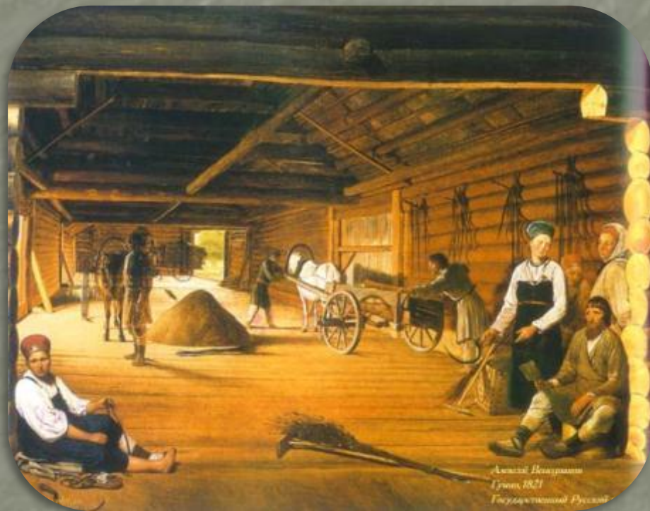
А. Венецианов. Гумно.