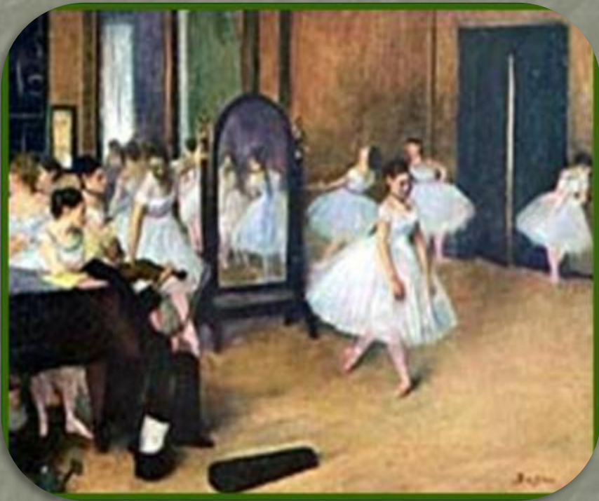
Эдгар Дега «Танцевальный класс»