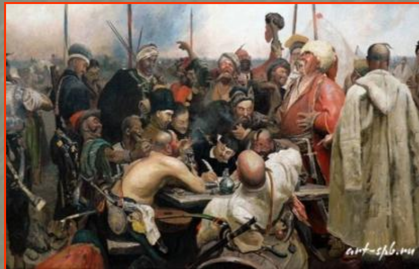
И.Репин «Запорожцы пишут письмо турецкому султану»