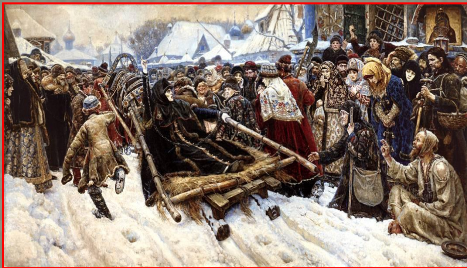
В.Суриков «Боярыня Морозова»

жанр изобразительного искусства, посвященный историческим событиям и деятелям, а также социально значимым явлениям в истории общества.