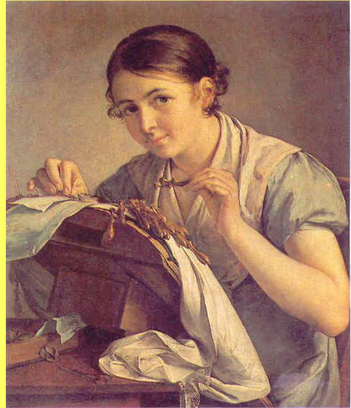
В. Тропинин. Кружевница.

Портрет - один из самых распространенных жанров изобразительного искусства, причем на картине могут быть изображены один или несколько человек.