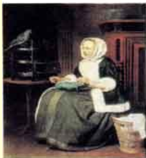
Г. Метсю. Девушка за работой.