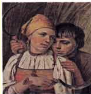
А. Венецианов. Жнецы

Он изображает разные стороны жизни человека: труд и отдых, праздники и будни, забавы и серьезные занятия.