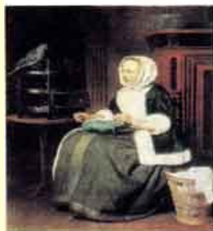
Г. Метсю. Девушка за работой.