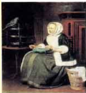
Г. Метсю. Девушка за работой.