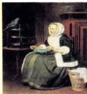
Г. Метсю. Девушка за работой.