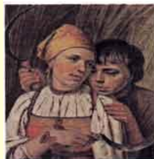
А. Венецианов. Жнецы

Он изображает разные стороны жизни человека: труд и отдых, праздники и будни, забавы и серьезные занятия.