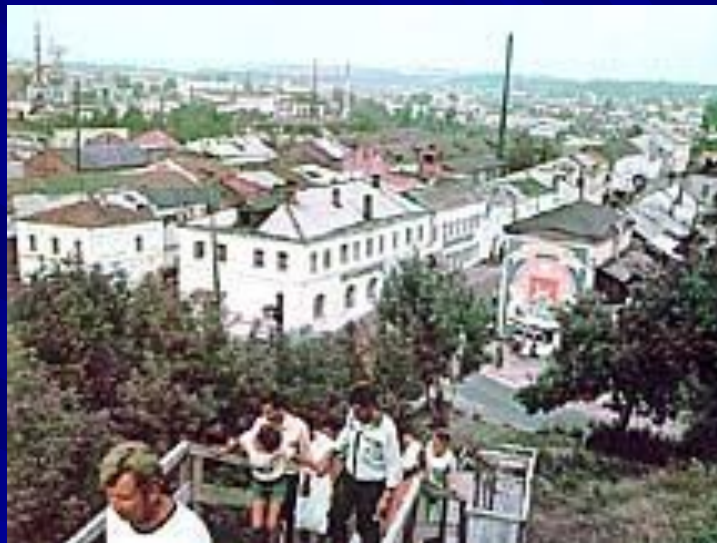
Городец. Панорама города

Город Городец находится там же, где и Хохлома, в Нижегородской области.