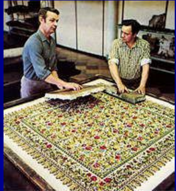
Процесс набивки цвета

Узоры на посадских платках печатают. Сначала на деревянной форме вырезают изображение цветков на платке. Каждый цвет печатается с отдельной доски. Для одного платка таких досок нужно несколько десятков.