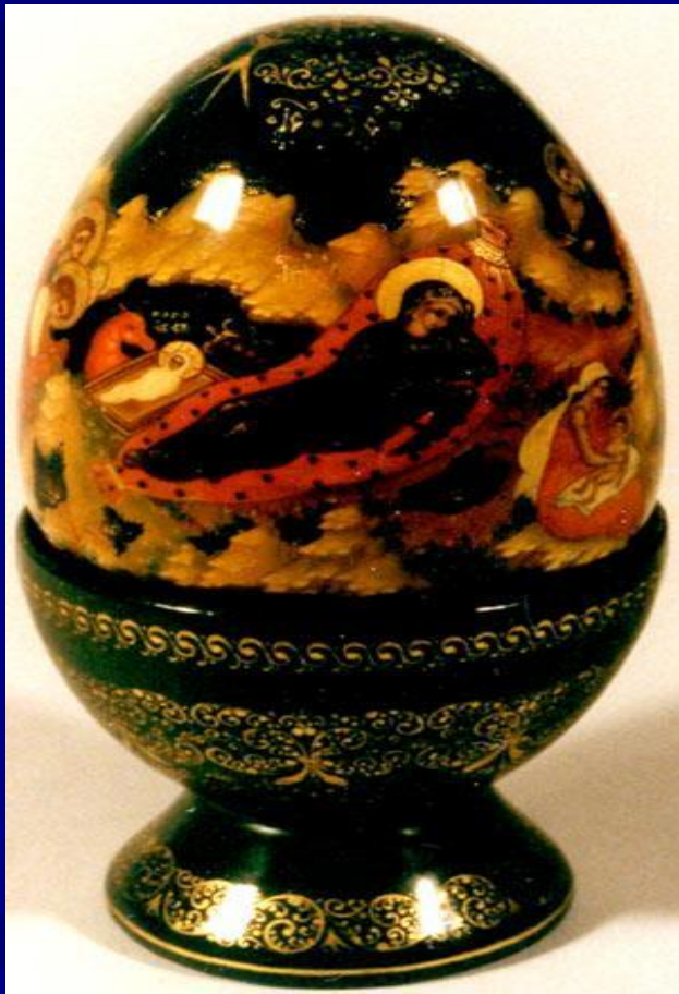
Палех. Пасхальное яйцо