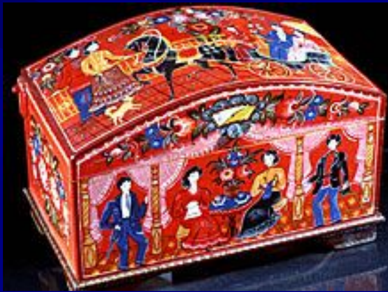
Городецкая роспись. Шкатулка

На изделиях из Хохломы можно увидеть только травяной или цветочный узор четырёх цветов, а на городецкой росписи встречаются люди, животные, птицы, используется синий, жёлтый цвет, но нет золотистого хохломского цвета.