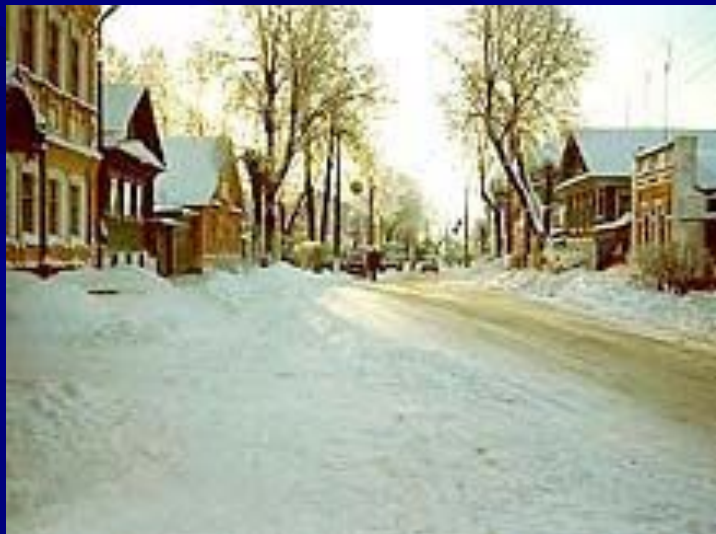
Городец. Дома с барочной резьбой