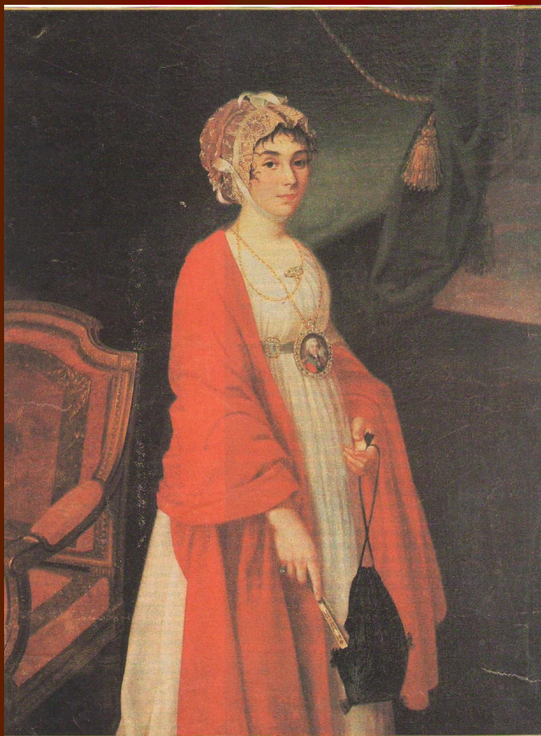
И. АРГУНОВ. Портрет П. Ковалевой-Жемчуговой (в красной шали). 1802—1803 гг.

Есть что-то в ней, что красоты прекрасней, Что говорит не с чувствами – с душой; Есть что-то в ней над сердцем самовластней Земной любви и прелести земной.