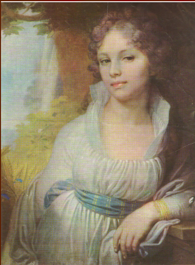
В. Боровиковский, 1757—1825. ПОРТРЕТ М. И. ЛОПУХИНОЙ. 1797.