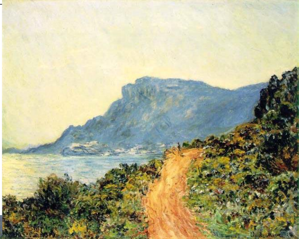
Рис.8 Моне К. «Пейзаж в Монако»

Импрессионисты предложили новое видение мира и новые принципы живописи. Они воспринимали окружающую действительность как бесконечную смену впечатлений. Картина становится как бы отдельным кадром, фрагментом подвижного мира. Появилась свежесть и непосредственность в изображении повседневной жизни современного города, его пейзажей, вида, быта и развлечений его жителей.