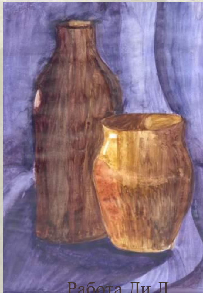
Работа Ли Л.