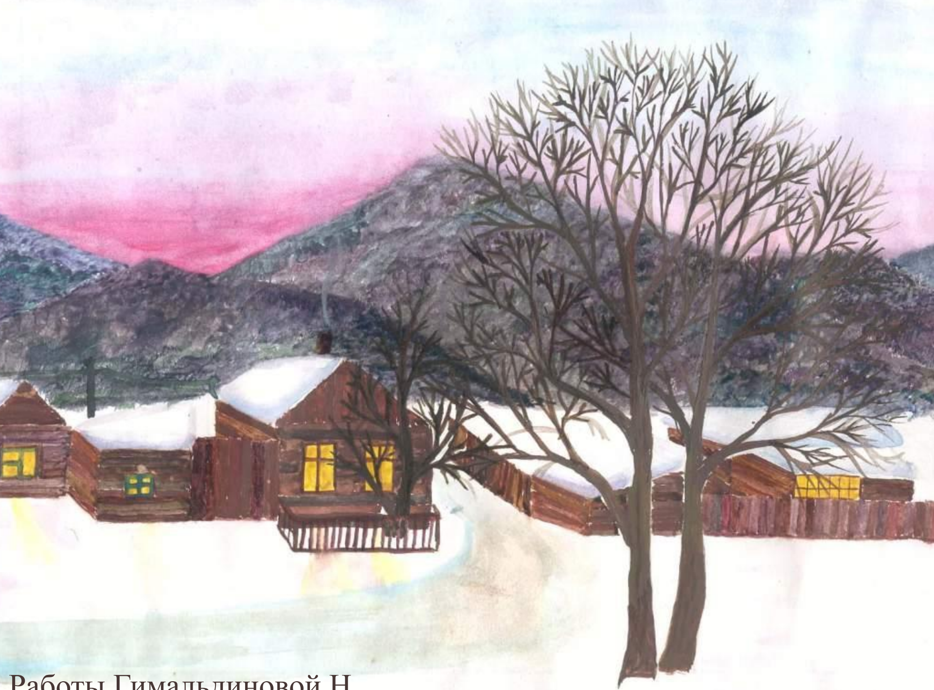
Работы Гимальдиновой Н.