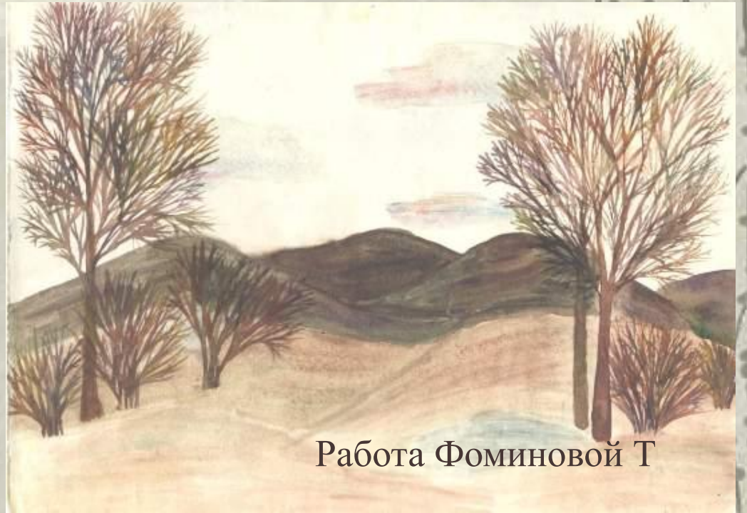
Работа Фоминовой Т