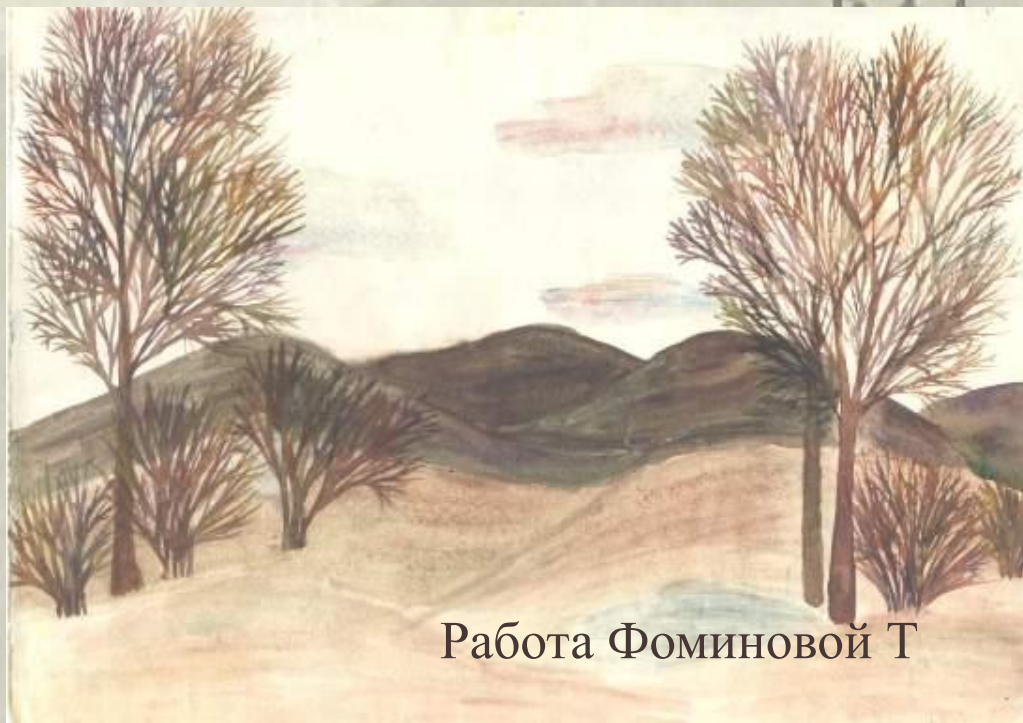
Работа Фоминовой Т