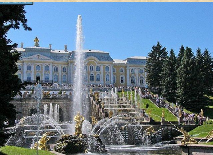
Петергоф. Большой дворец