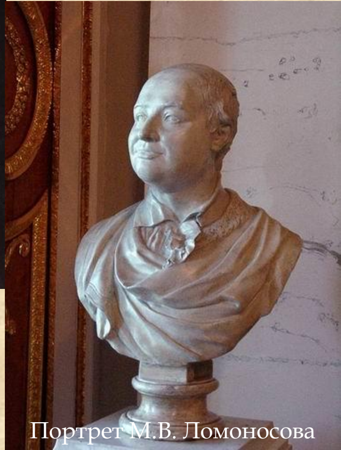
Портрет М.В. Ломоносова